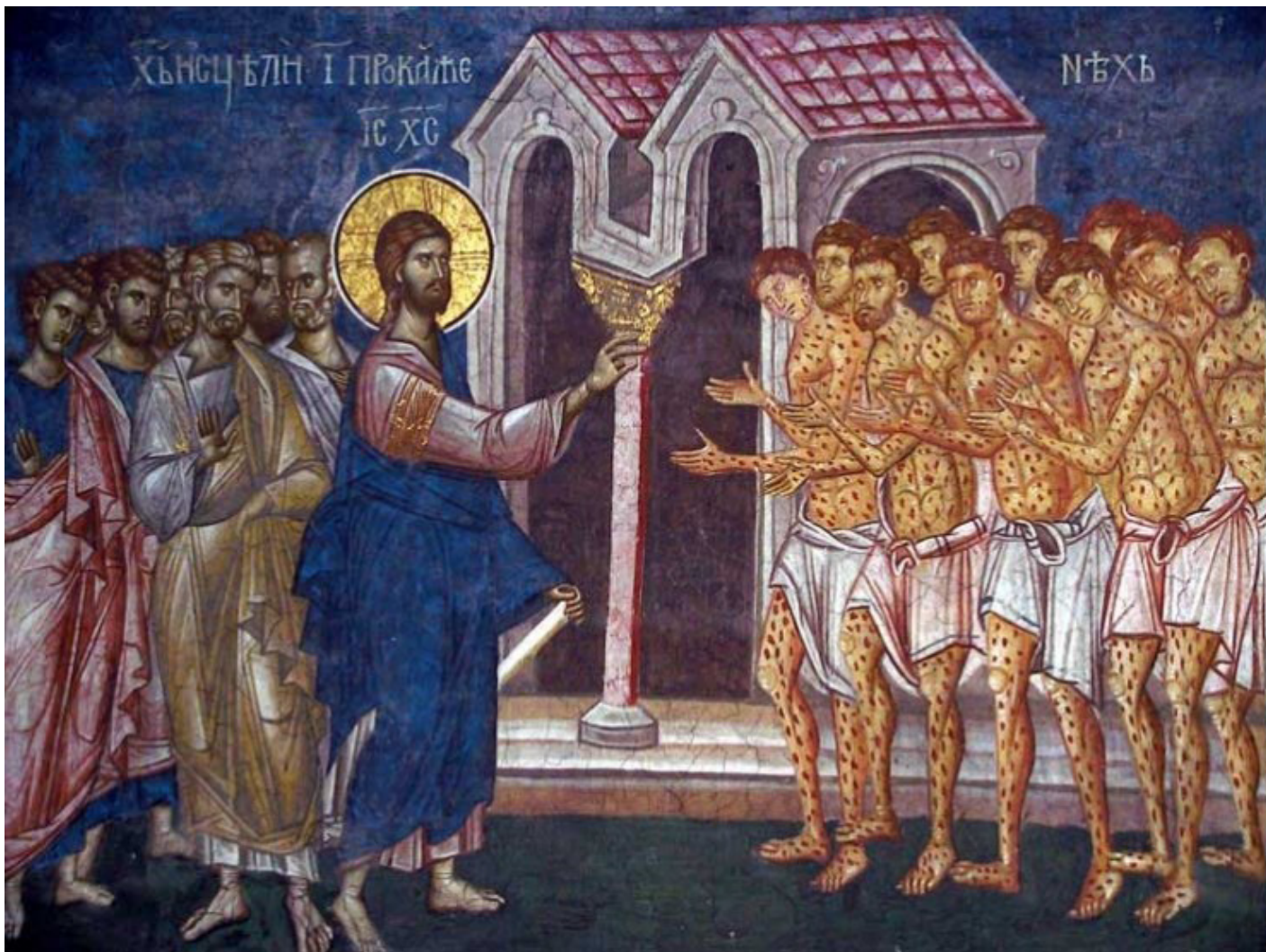
Исцеление десяти прокаженных. Косово, монастырь Высокие Дечаны. XIV век