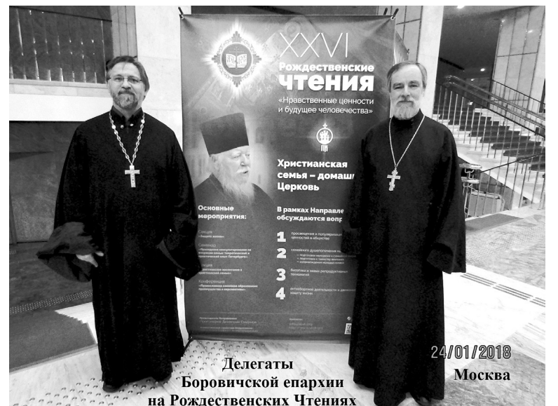
Делегаты Боровичской епархии на Рождественских Чтениях

Во-первых, нет научного определения срока беременности, с которого зачатый ребенок считается человеком.