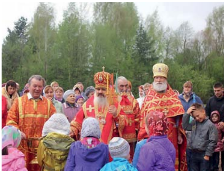
Архиерейское богослужение 11 мая 2014 года