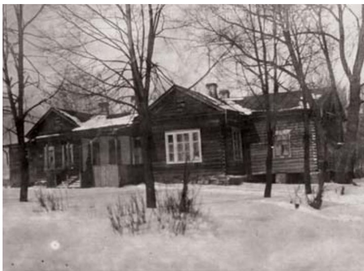
Усадебный дом. Полыновка