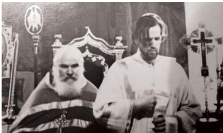
Рукоположение в иереи

А дальше произошло и вовсе невероятное. В те годы в армии служили 3 года, и как раз был переход на двухгодичный срок службы. Виталия одного из немногих демобилизовали в 2 года 7 месяцев, несмотря на то,