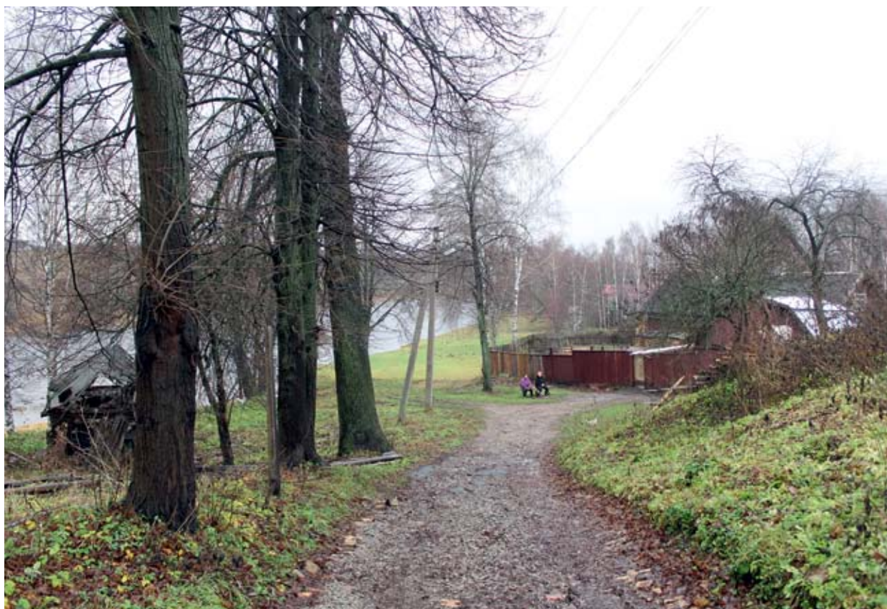
Здесь была родовая усадьба. Устье