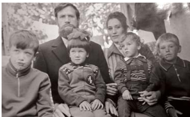
Семья отца Виталия

Правда, после этого случая все дети семьи священника обязаны были посещать уроки физкультуры в майках, чтобы креста не было видно. Мальчик тогда недоумевал: прежний учитель таджик не запрещал носить крестик, а пришла русская – и попыталась его снять! Как такое возможно? «Но, что интересно, именно русские учителя