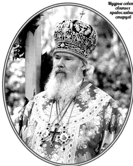
Мудрые советы святых православных старцев