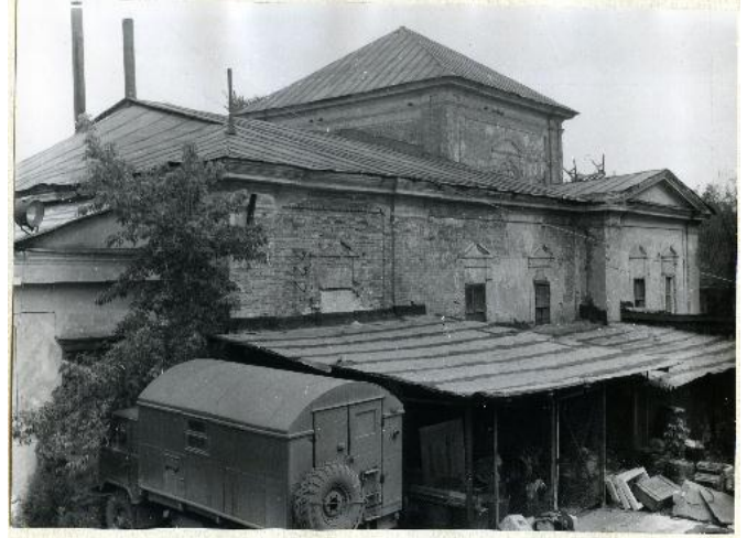
Фото 3. лето 1990 г. Южный фасад, хоздвор автобазы, сараи.

(5 декабря н.с.) 1853 г. строительные работы были окончены и Преосвященнейшим Антонием, епископом Оренбургским и Уфимским, совершен чин Великого освящения храма.