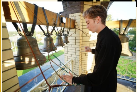
Звонница храма Кирилла и Мефодия