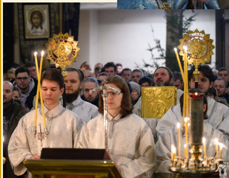
На Божественной Литургии