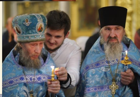
Общение со старцами