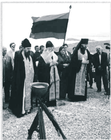
27 сентября 2005 г. Архиепископ Алексий совершает панихиду на Русском кладбище

трёхлетнего сына. Вот такие повороты судьбы.