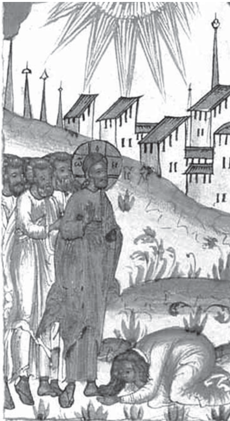
1693г. Иллюстрация к Евангелию Апракос, библиотека Акад. наук

Архиепископ Сиракузский и Троицкий Аверкий (Таушев)