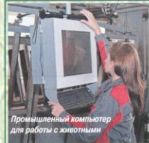
Промышленный компьютер для работы с животными