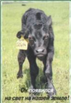
Она появилась на свет на нашей земле!