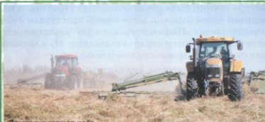
Заготовка кормов идёт полным ходом