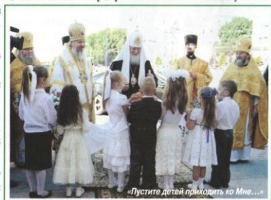
«Пустите детей приходить ко Мне...»