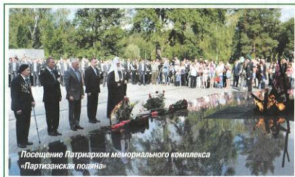
Посещение Патриархом мемориального комплекса «Партизанская поляна»

Святейшего Патриарха сопровождали: Епископ Брянский и Севский АЛЕКСАНДР, члены официальной делегации Русской Православной Церкви, полномочный представитель Президента РФ в Центральном федеральном округе А. Д. Беглов, губернатор Брянской области Н. В. Денин.