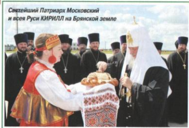
Святейший Патриарх Московский и всея Руси КИРИЛЛ на Брянской земле

В конце июня — начале июля сего года Брянскую Епархию посетил Святейший Патриарх Московский и всея Руси КИРИЛЛ