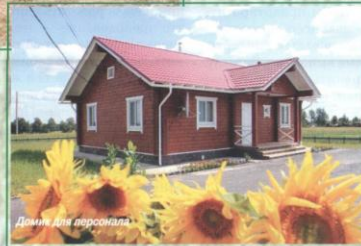
Домики для персонала

К чему нельзя было привыкнуть, так это к тому, что поля наши зарастали не только бурьяном, но уже и деревьями. А на фоне этого стояли разорённые фермы для животных, вернее сказать, то, что от них осталось... Напоминало всё это какую-то страшную послевоенную разруху. И надежды на то, что придёт сюда хозяин, как-то было уж слишком мало. И Господь не дал землю на поругание, а результаты труда ООО «Брянская мясная компания» агропромышленного холдинга «Мираторг» давно видны – заброшенных полей уже практически нет.