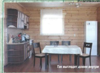
Так выглядит домик внутри

наши земли приедут инородцы! Но ныне уже 1600 местных жителей трудоустроены, а к 2014-2015 гг. в двух проектах, которые реализует «Мираторг» на Брянщине, будут работать уже 6000 человек.