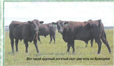
Вот такой крупный рогатый скот уже есть на Брянщине