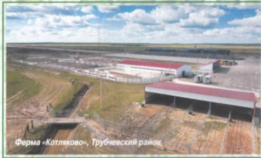
Ферма «Котляково», Трубчевский район

Постоянному читателю «Путеводительницы» довольно давно, наверное, с самых первых номеров, заметна одна важнейшая тема газеты – тема болезненная, острая и очень важная! Она – о вымирании нашего русского села. Мы много говорили и говорим об этом, ведь всем людям, кому небезразлична судьба нашего Отечества, ясно и понятно: с вымиранием села начнутся и нестроения во всём государстве, так как всё это звенья одной цепи. И тем радостнее сообщить сегодня, что в глубинке земли Брянской возрождение началось и идёт быстрыми темпами!