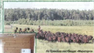
На брянских пастбищах «Мираторг»

К чему нельзя было привыкнуть, так это к тому, что поля наши зарастали не только бурьяном, но уже и деревьями. А на фоне этого стояли разорённые фермы для животных, вернее сказать, то, что от них осталось... Напоминало всё это какую-то страшную послевоенную разруху. И надежды на то, что придёт сюда хозяин, как-то было уж слишком мало. И Господь не дал землю на поругание, а результаты труда ООО «Брянская мясная компания» агропромышленного холдинга «Мираторг» давно видны – заброшенных полей уже практически нет.