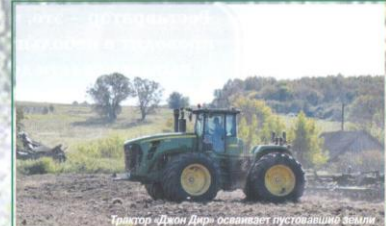
Трактор «Джон Дир» осваивает пустошами земли

Постоянному читателю «Путеводительницы» довольно давно, наверное, с самых первых номеров, заметна одна важнейшая тема газеты – тема болезненная, острая и очень важная! Она – о вымирании нашего русского села. Мы много говорили и говорим об этом, ведь всем людям, кому небезразлична судьба нашего Отечества, ясно и понятно: с вымиранием села начнутся и нестроения во всём государстве, так как всё это звенья одной цепи. И тем радостнее сообщить сегодня, что в глубинке земли Брянской возрождение началось и идёт быстрыми темпами!