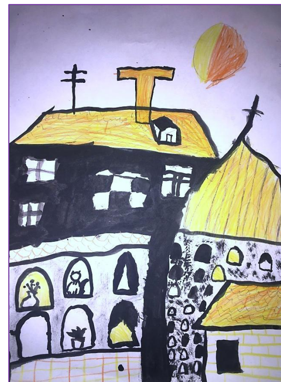
«Вечер над городом»