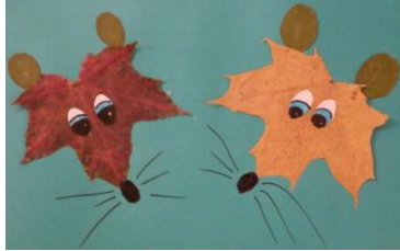
«Мышки» София, 11 лет

Дорогие братья и сестры! Осенью при нашем храме проходил конкурс аппликаций, поделок из природных материалов и рисунков на осеннюю тему. К сожалению, участники так быстро разбежались после награждения, что мы не успели их сфотографировать, поэтому ниже мы приводим фотографии только их работ.