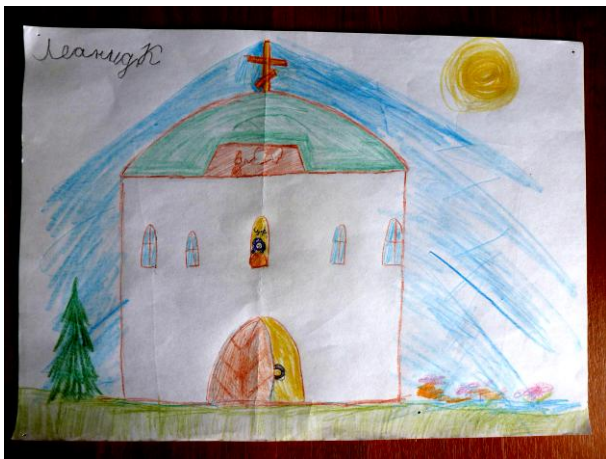
“Мой храм”. Леонид, 7 лет Бумага, цветные карандаши