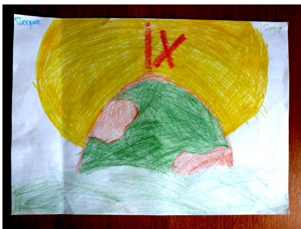
"Гора Фавор". София, 11 лет Бумага, цветные карандаши