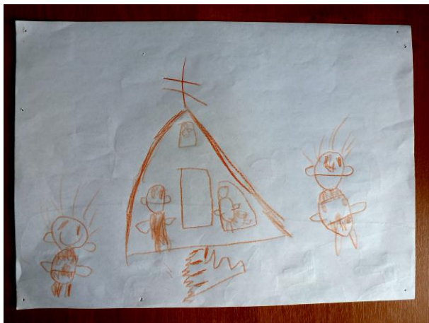
“Мой храм”. Работа неизвестного автора. Бумага, цветные карандаши