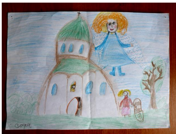
"Мой храм". София, 11 лет Бумага, цветные карандаши