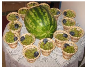
Подарки для участников были очень вкусные!