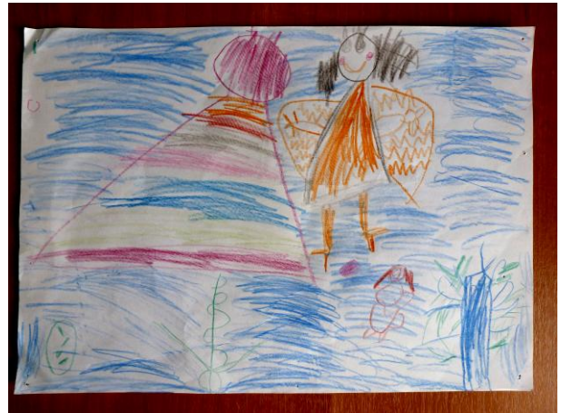
“Мой храм”. Серафима, 5 лет Бумага, цветные карандаши