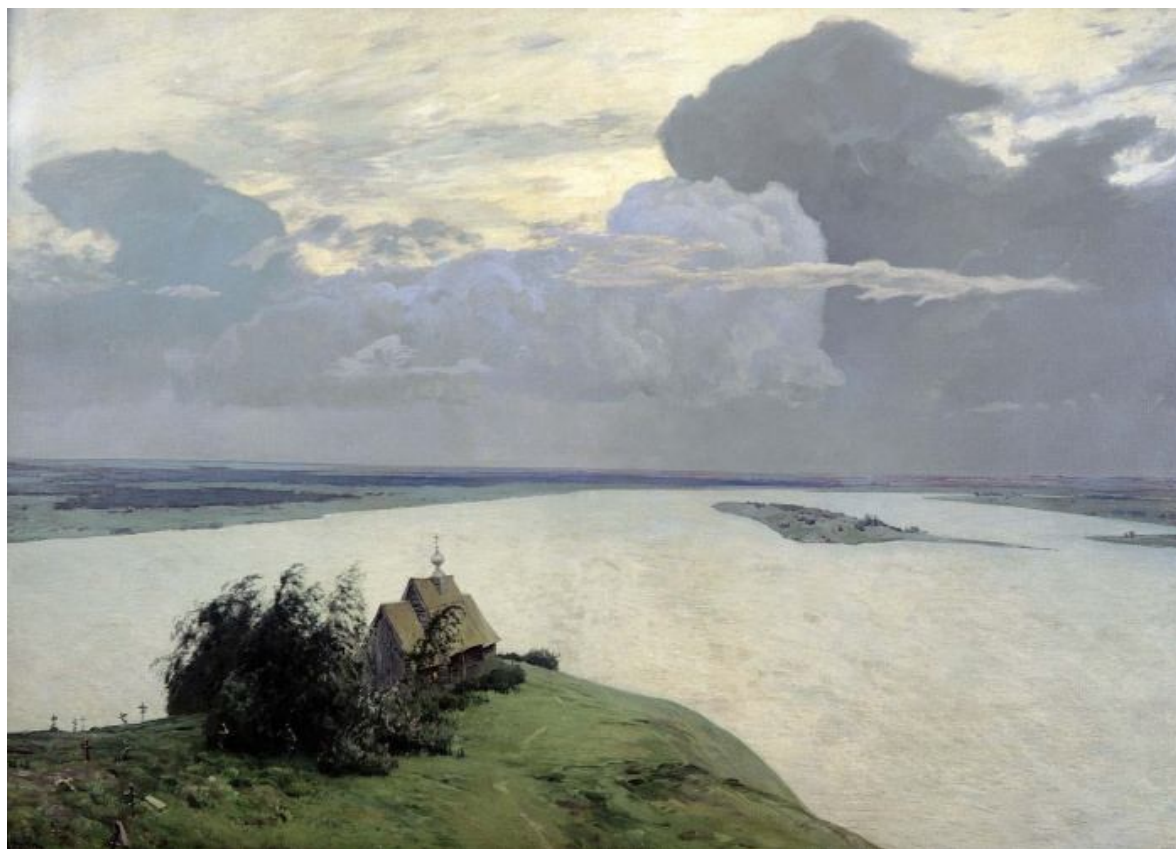
И. И. Левитан. Над вечным покоем. 1894

По благословению Святейшего Патриарха Московского и всея Руси Алексия II