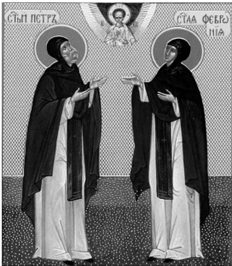
Петр и Феврония Муромские – супруги, святые, ярчайшие личности Святой Руси, своей жизнью отразившие ее духовные ценности и идеалы.

История жизни свв. чудотворцев, благоверных и преподобных супругов Петра и Февронии, много веков существовала в преданиях Муромской земли, где они жили и где сохранялись их честные мощи. Со временем подлинные события приобрели сказочные черты, слившись в народной памяти с легендами и притчами этого края. Сейчас исследователи спорят, о ком из исторических личностей написано житие: одни склоняются к тому, что это были князь Давид и его жена Евфросиния, в иночестве Петр и Феврония, скончавшиеся в 1228, другие видят в них супругов Петра и Евфросинию, княживших в Муроме в XIV в.