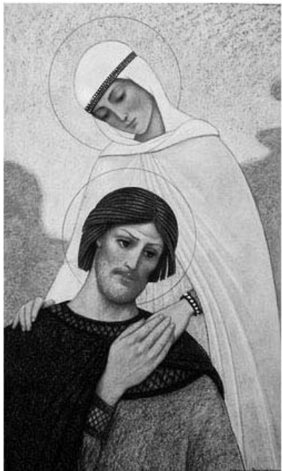
В «Троицких листках с луга духовного» есть такой рассказ. Однажды жена узнала об измене мужа. Она

КОГДА СЛЫШИШЬ СЛОВО СЧАСТЬЕ, ТО ОТ САМОГО ЭТОГО СЛОВА В ДУШЕ РОЖДАЕТСЯ СВЕТЛОЕ ОЩУЩЕНИЕ РАДОСТИ БЫТИЯ, СОУЧАСТИЯ. СЧАСТЬЕ – ЭТО ГАРМОНИЯ ДУХА, ДУШИ И ТЕЛА. КОГДА ТЕЛО ПОДЧИНЯЕТСЯ ДУШЕ, А ДУША – ДУХУ. НЕ ЛЕБЕДЬ, РАК И ЩУКА, КАК В БАСНЕ КРЫЛОВА, А КОГДА РАЗУМУ ПОДЧИНЕНЫ ЧУВСТВА И ДВИЖЕНИЯ ПЛОТИ. ПОСМОТРИТЕ, К КАКИМ КАТАСТРОФИЧЕСКИМ ПОСЛЕДСТВИЯМ МОГУТ ПРИВЕСТИ ТЕЛОДВИЖЕНИЯ, НЕ ПОДЧИНЕННЫЕ ДУХУ. ТЕЛО УВИДЕЛО КРАСИВУЮ ЖЕНЩИНУ И ПОШЛО ПО ПРИЗВАНИЮ НИЗМЕННЫХ ПОТРЕБНОСТЕЙ НА ГРЕХОВНОЕ ДЕЛО. А РАЗУМ ГОВОРИТ: НЕ В ЭТОМ СЕМЕЙНОЕ СЧАСТЬЕ... А ТЕЛО НИ С КЕМ НЕ СОВЕТУЕТСЯ, ОНО ПРОСТО ХОЧЕТ, ИДЕТ И ДЕЛАЕТ, ОНО НЕ ДУМАЕТ О ПОСЛЕДСТВИЯХ.