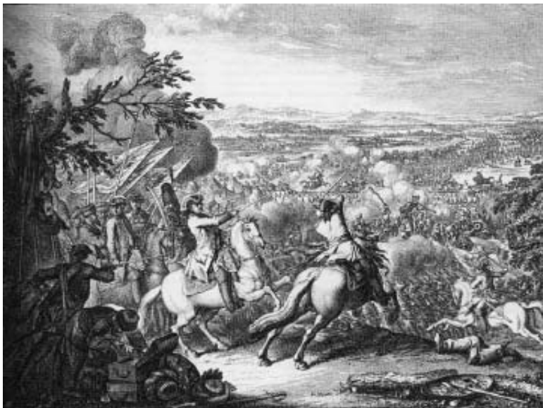
10 ИЮЛЯ РОССИЯ ОТМЕЧАЕТ ДЕНЬ ПОБЕДЫ НАД ШВЕДАМИ В ПОЛТАВСКОМ СРАЖЕНИИ

Шведский король Карл XII имел к 1708 году первоклассную армию и флот. Он нанёс поражение польской, саксонской и русской армии (в первые годы войны), а в наступлении на Россию намеревался занять Москву и здесь продиктовать свои условия мира: «Петр будет свергнут с престола, и на его трон сядет шведский ставленник. Псков, Новгород и весь север России станут шведским владением. Украина и Смоленщина перейдут под власть Станислава Лещинского — польского короля. Южные земли России достанутся туркам и крымским татарам».