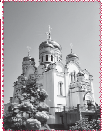
Свид. №216 от 12 июля 2012г.

17 ДЕКАБРЯ 2014 ГОДА ОТ РОЖДЕСТВА ХРИСТОВА