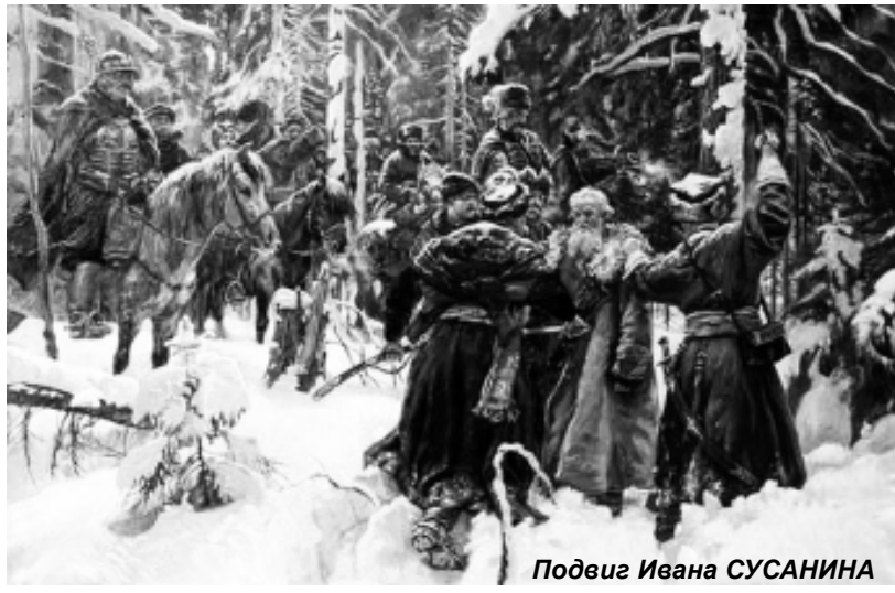
Подвиг Ивана СУСАНИНА

Наконец народное ополчение под командованием Минина и Пожарского осенью 1612 года подошло к Москве, где к нему (опять-таки по настоятельному убеждению А. Палицына) присоединились отряды казаков из остатков первого ополчения под командой Трубецкого. Поляки