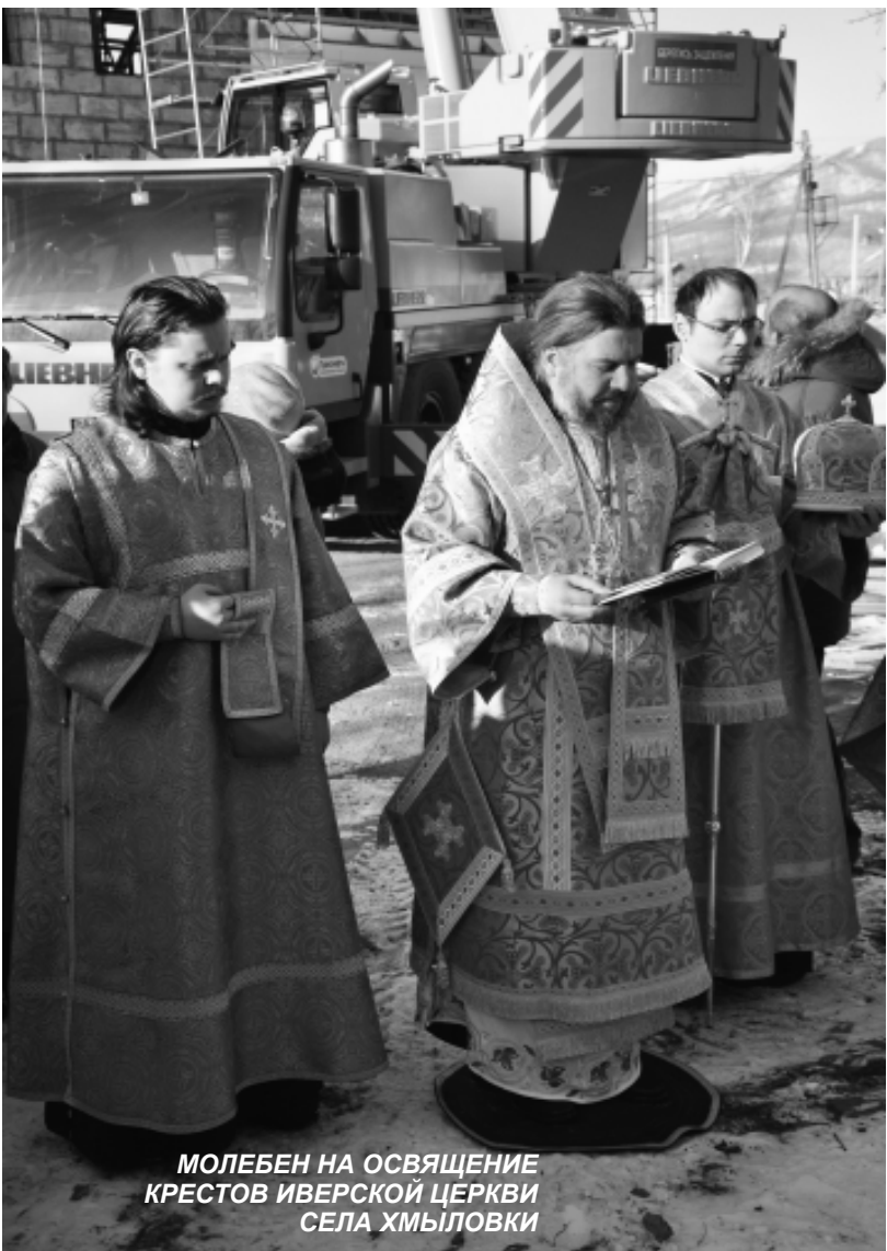
МОЛИБЕН НА ОСВЯЩЕНИЕ КРЕСТОВ ИВЕРСКОЙ ЦЕРКВИ СЕЛА ХМЫЛОВКИ