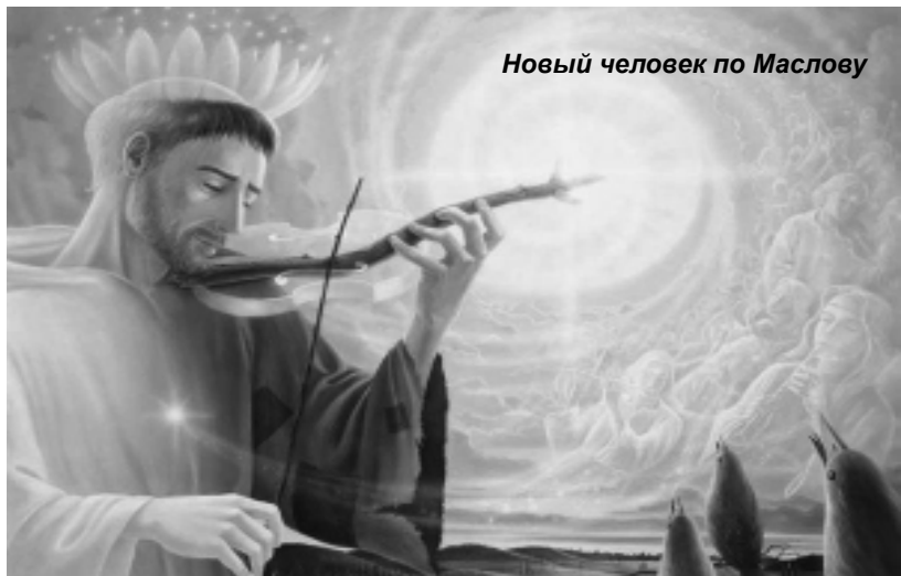
Новый человек по Маслову

«Счастье есть, его не может не быть!» – неофициальный лозунг языческого течения, которое называется «Союз сотворцов Святой Руси» Межрегионального общественного Движения «За государственность и духовное возрождение России». «Вот оно, рядом, это счастье! В тебе и во мне! В атоме, в частичке твоего тела! Ура, товарищи!». «Пришло время преобразовать себя через квантовый переход, который начался в эпоху водолея!».