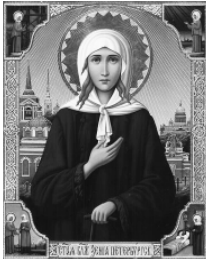
В 1986 году митрополит Алексий (ныне Патриарх Московский и всея Руси) принял под свой святительский омофор сверх окормляемой им