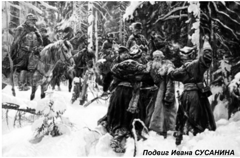
Подвиг Ивана СУСАНИНА

Наконец народное ополчение под командованием Минина и Пожарского осенью 1612 года подошло к Москве, где к нему (опять-таки по настоятельному убеждению А. Палицына) присоединились отряды казаков из остатков первого ополчения под командой Трубецкого. Поляки