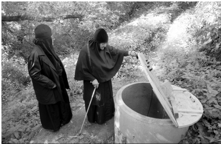
На источнике под горой. «Водные» трудности насельников постепенно уходят в прошлое.

момент откуда ни возьмись появляются жертвователи, везут масло, сахар, рыбу, муку... И как раз этой снеди хватало, чтобы продержаться в самые трудные дни. Подобных моментов на моей памяти - не один и не два,