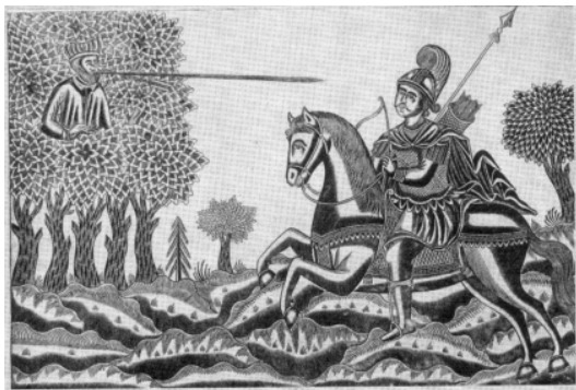
Илья Муромец и Соловей-разбойник. Лубок. 1837 г.

Центральный образ русского эпоса - Илья Муромец, все подвиги которого связаны с задачей служения народу, обереганием русской земли. В одной из самых известных былин этот знаменитый богатырь, побеждая Соловья-разбойника, очищает «дорожку прямоезжую». Традиционный сюжет любого народного эпоса - мифическое чудовище преграждает дорогу герою - в данном случае вполне соот-