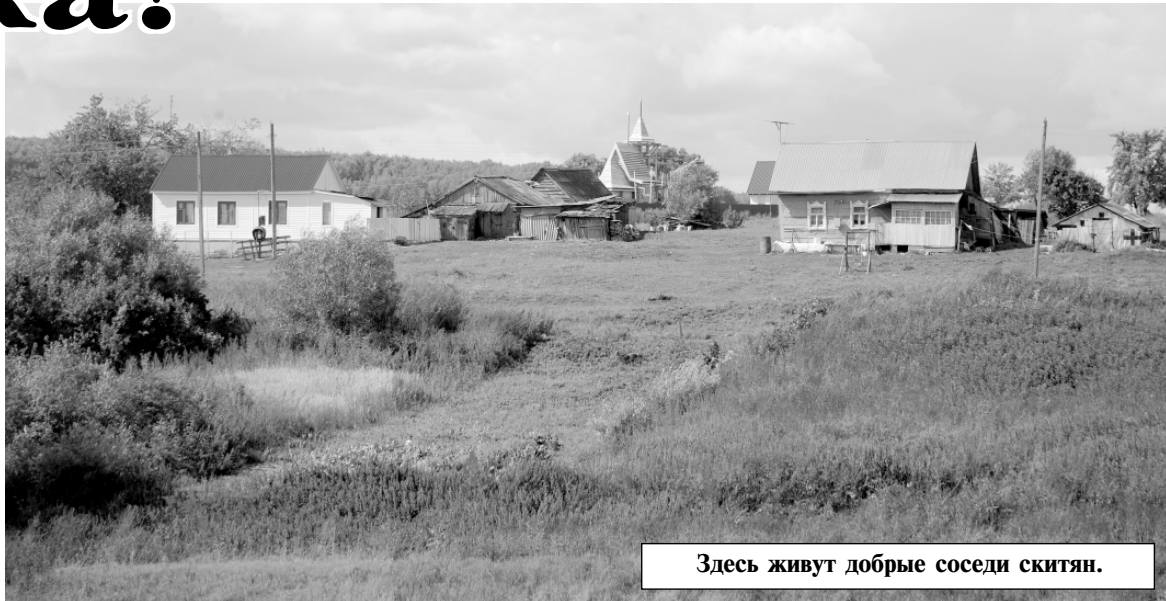
Здесь живут добрые соседи скитян.

ми веры, с ней легко беседовать на духовные темы.