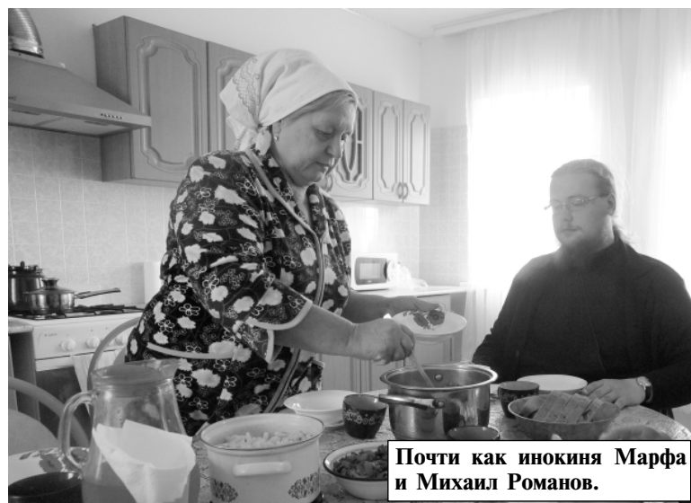
Почти как инокиня Марфа и Михаил Романов.

после юбилейных торжеств, когда о Серенской пустыни узнают многие, придут сюда новые соратники Христа и будут