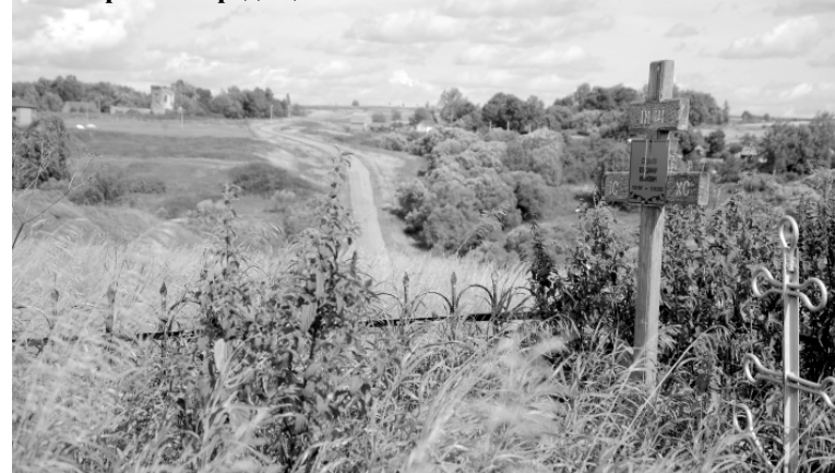
Заросшее современное кладбище на вершине городища.

шкиным и Т.М. Хохловой - в 1998 г. Селище 2 обследовано О.Л. Прошкиным в 1998 г. Наиболее масштабными были работы Никольской, по итогам которых была издана в 1981 г. монография «Земля вятичей». Раскопки последнего времени велись в рамках охранных мероприятий.