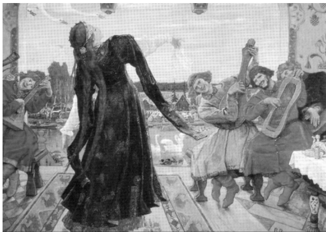
Царевна-лягушка. Русская народная сказка.