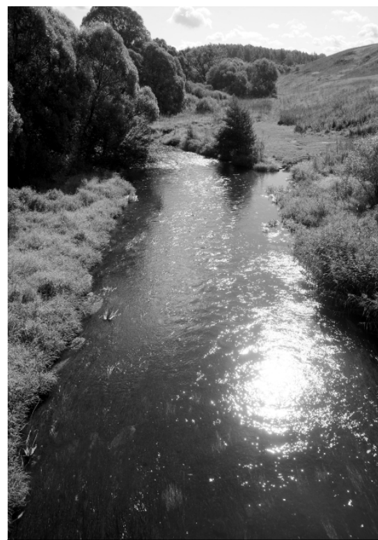
Овеянная легендами река Серена.