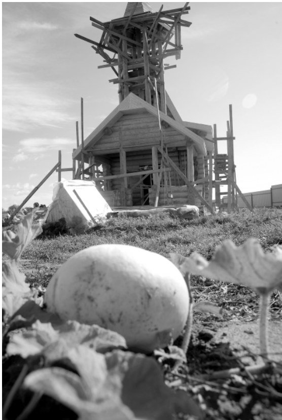
Поспевает первый урожай.

езжает в Серенск помогать новой обители. Статная, сероглазая русская красавица дух в себе имеет богатырский. Она и морально поддержит, слёзы чужие утрёт, и сама празднично ни-