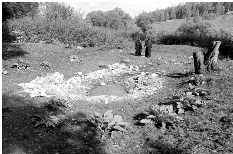
На источнике живой воды.

Нам рассказывали про одного мужчину, который, напившись из этого родника, чуть не умер - еле откачали в больнице.