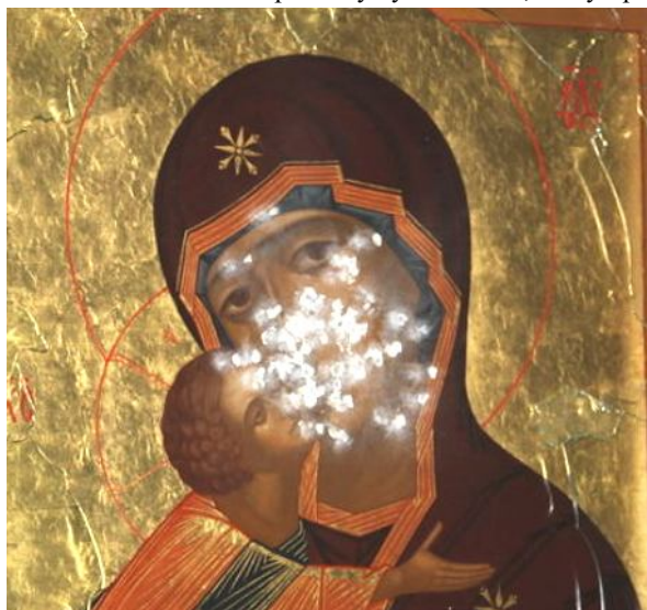
Расстрелянная вандалом икона

Сахалинский расстрел - определенный рубеж, за которым маячит призрак страшной гражданской войны. Корни у этой трагедии имеют социальный характер. Поэтому власти должны извлечь серьезные уроки из сахалинской трагедии, а не пытаться представить ее как «неадекватный поступок психически больного человека».