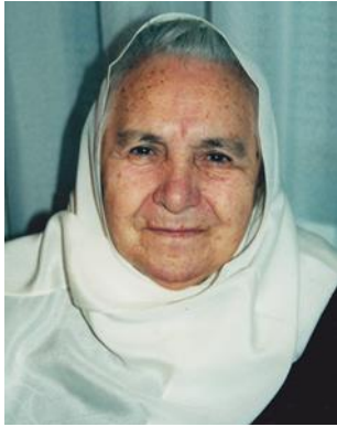
На 80летний юбилей 17.11.2001г.