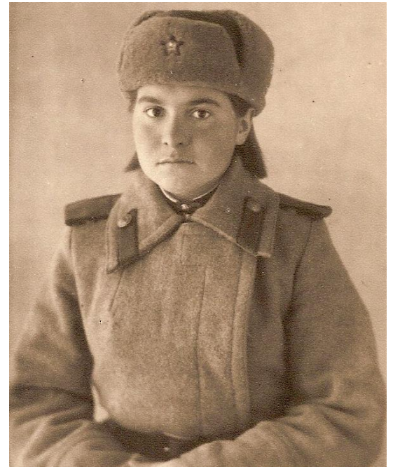
На фронте 07.02.1945 г., Рига