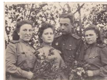
Вносавцы после войны 14.06.1945