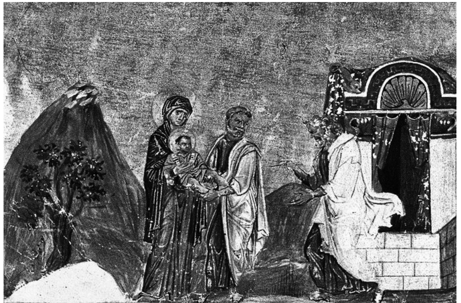
Минология Василия II. Константинополь. 985 г.

детельствует о вступлении человека в Новый Завет с Богом.