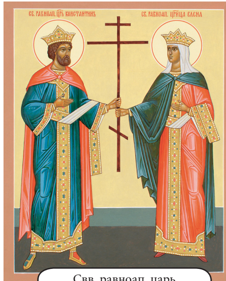
Свв. равноап. царь Константин и царица Елена

313 году Миланский эдикт о веротерпимости, а в 323 году, когда воцарился как единственный император над всей Римской империей, распространил действие Миланского эдикта и на всю восточную часть империи. После трехсот лет гонений христиане впервые получили возможность открыто исповедовать свою веру во Христа.