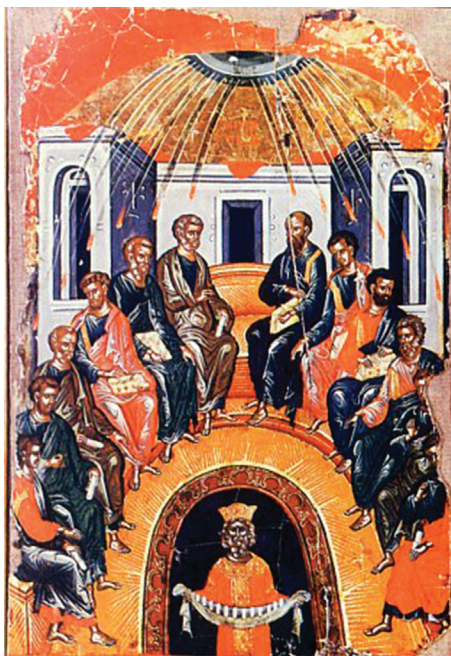
Сошествие Святого Духа на апостолов Икона XV в о. Патмос

В Праздник Пятидесятницы принято украшать храм и свои жилища деревянными ветвями и цветами, и самим стоять в храме с цветами в руках. Украшение храмов и жилищ в этот день зеленью и цветами бывает, во-первых, исповеданием зиждательной силы Животворящего Духа; а во-вторых, - должным посвящением Ему начатков весны.