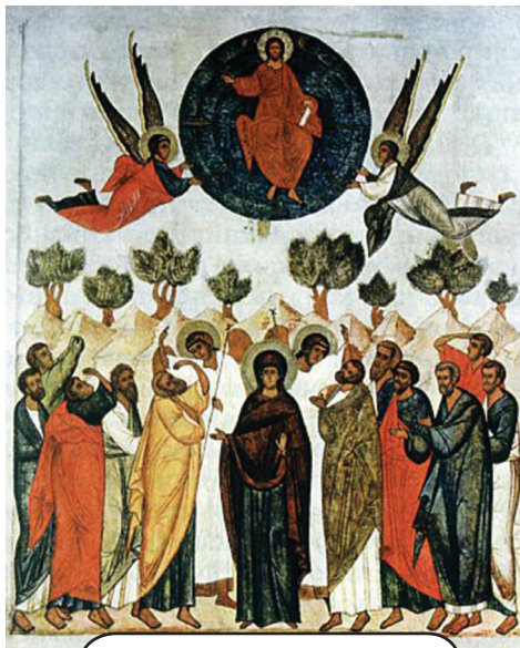
Вознесение Господне Икона XVIв. Новгород.

Спаситель же сказал им: «не ваше дело знать времена или сроки, которые Отец положил в Своей власти. Но вы примете силу, когда сойдет на вас Дух Святый, и будете проповедовать обо Мне в Иеруса-