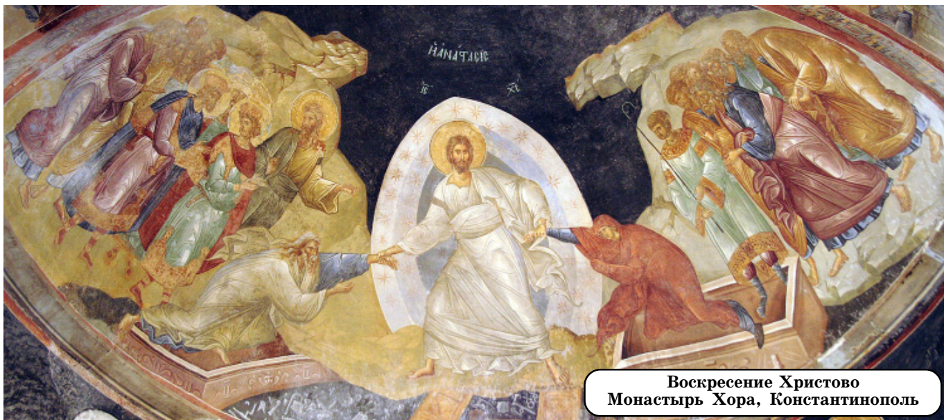
Воскресение Христово Монастырь Хора, Константинополь