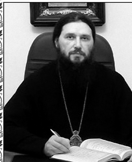
Митрополит Волгоградский и Камышинский Феодор

Между средней частью храма и его главной частью – алтарем – находится иконостас . Он располагается на некотором возвышении, на солее , центр которой перед Царскими вратами образует полукруглый выступ, который называется амвон . Это место знаменует собой гору, с которой проповедовал Сам Господь Иисус Христос. И сегодня с амвона священнослужители обращаются к народу с проповедью, здесь произносятся ектении и читают Евангелие. На амвоне же преподаются верующим и Святое Причастие . Справа и слева по краям солеи устраиваются клиросы , где поют певчие. Также петь могут и на хорах сверху. Хоры на клиросе называют собой хоры ангелов, воспевающих славу Божию.