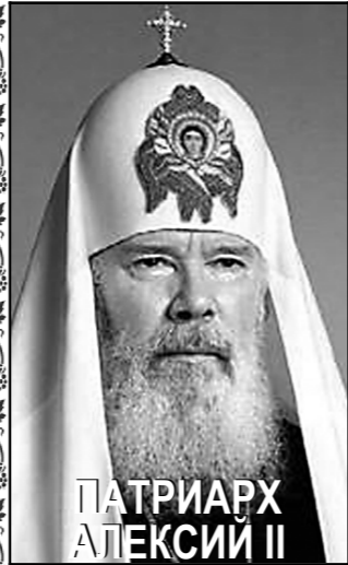
ПАТРИАРХ АЛЕКСИЙ II

Его Святейшество Святейший Патриарх Московский и всея Руси Алексий Второй – 15-ый Предстоятель Русской Православной Церкви с введения Патриаршества на Руси, родился 23 февраля 1929 г. в городе Таллине в глубоко верующей семье.