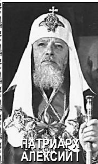
ПАТРИАРХ АЛЕКСИЙ I

Патриарх Алексий I, в миру Сергей Владимирович Симанский, был 13-ым главой Русской Православной Церкви. На время его патриаршества, которое длилось 25 лет, пришлось три эпохи развития Российского государства.