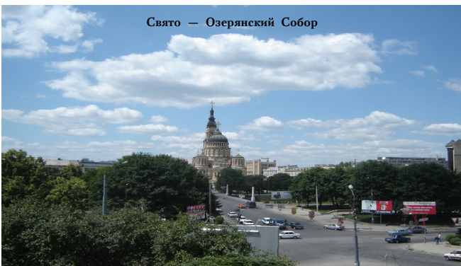
Свято — Озерянский Собор

Известно немало сведений о том, как благодаря Озерянской иконе, излечивались физические недуги и даже прекращались эпидемии инфекционных заболеваний. В 1871г. была остановлена эпидемия холеры, чудотворную икону перевезли в Харьков и носили по домам улицам и лавкам, везде служили молебны, а к иконе прикладывались даже иноверцы!