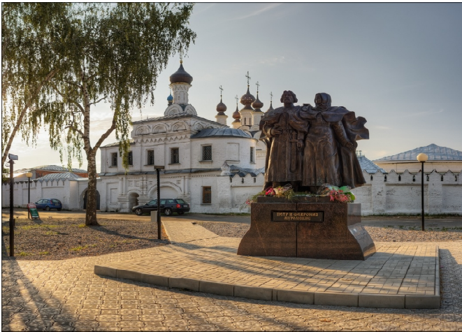
Мы же, по силе нашей, сложим им хвалу. Материал использован с сайта: http://nesusvet.narod.ru

После их смерти хотели люди положить блаженного князя Петра внутрь города у соборной церкви пречистой Богородицы, Февронию же - вне города в женском монастыре у церкви Воздвижения честного креста, говоря, что в монашеском образе нельзя положить святых в одном гробе. И сделали им отдельные гробы, и положили в них тела: святого Петра, названного Давидом, положили в отдельный гроб и поставили его в церкви святой Богородицы в городе до утра, тело же святой Февронии, названной Ефросиньей, положили в отдельный гроб и поставили вне города в церкви Воздвижения честного и животворящего креста. Общий же гроб, который они повелели сами себе вытесать в одном камне, стоял пустой в том же храме соборной пречистой церкви, что внутри города. Утром, проснувшись, люди нашли их отдельные гробы, в которых их положили, пустыми. Святые же их тела нашли внутри города в соборной церкви пречистой Богородицы в едином гробе, в который они сами себе велели сделать. Неразумные люди, как при жизни их мятущися, так и после честного их преставления, опять переложили их тела в отдельные гробы и снова разнесли. И вновь наутро оказались святые в едином гробе. И после этого уже не смели прикасаться к их святым телам и положили их в едином гробе, в котором они сами велели, у соборной церкви Рождества пресвятой Богородицы внутри города, что дал Бог на просвещение и спасение городу тому, и те, кто с верою приходят к раке их мошей, неоскудное исцеление принимают.