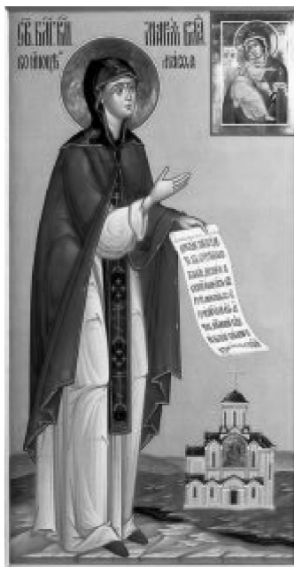
Икона великой княгини Марии Шварновны. Начало XXI в.

Возлюбленные мои дети! Вот вы видите меня весьма болящую, а вскоре я отою от сего маловременнаго света ко отцам своим. И так вы, доколе пребудете в суетном житии, первее всего имейте веру и любовь к Богу и Пречистой Его Матери, истинной Богородице, и всю силою потщитесь страх Божий в себе иметь. Святителям же и пресвитерам и всему священническому чину не стыдитесь главы своей приклонять, так как они служители Самого Бога и Пречистой Богородицы и пастыри словесных овец; почитающий священника Божия, Самого Бога почитает, а оскорбляющий священника Божия, Самого Бога оскорбляет. Всегда имейте тихость и кротость, и смиренномудрие, и любовь, и милость; алчущих насыщайте, жаждущих напоите, нагих одевайте, вольных посещайте и себя в чистоте соблюдайте. Милостыню всегда творите, ибо она поставит вас перед Богом; никакого человека не минуйте без приветия. Сами же между собою имейте нелицемерную любовь, и Бог мира и любви будет в