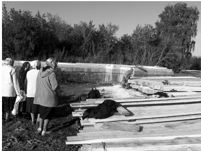
Пресс-служба прихода храма прп. Сергия Радонежского.

В этот же первый день осени, 1 сентября, произошло знаменательное событие в жизни Прихода и всего села Мохово: на строительную площадку в центре села была доставлена первая партия бруса, из которого будут строиться стены храма «Сошествия Святого Духа на апостолов» и в скором времени строительная бригада приступила к укладке первых венцов храма. Вторая партия была доставлена только двадцать третьего сентября. Строительство продолжается неспешно, но отраднo, что Господь не оставляет нас своей милостью, посылая добрых людей в лице жертвователей и благоустроителей деревянного сельского храма Святого Духа.