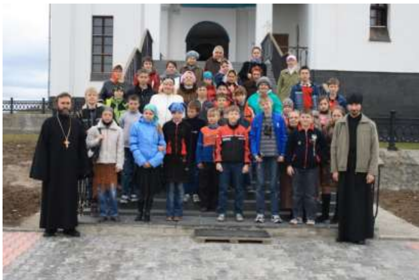
Паломническая поездка в г. Мончегорск 2008 г.