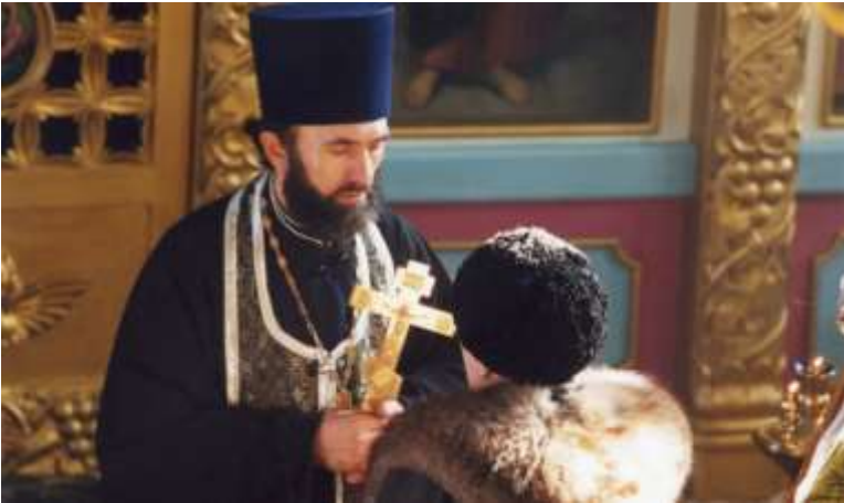
Беседа с батюшкой.

Жизнь прихода, насыщенная ежедневными делами, событиями и заботами, большая миссионерская, просветительская, организаторская деятельность, духовное окормление прихожан – все это не позволяло батюшке своевременно уделить внимание здоровью. Постоянное физическое перенапряжение, жизнь на пределе сил подточили его здоровье, но при этом он всегда оставался внимательным, заботливым духовным отцом, умеющим помочь, утешить и вселить надежду, а в трудной ситуации и пошутить, дать добрый совет, пастырское благословение.