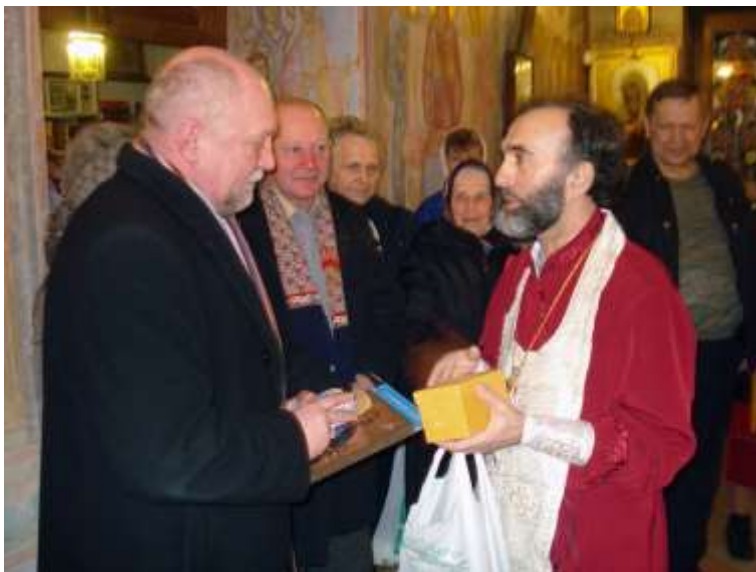
Встреча батюшкой Иконы Божьей Матери "Отрада и Утешение"