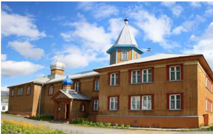
Храм Казанской иконы Божьей Матери на 23 км.

Ранее, в другой газетной статье, он скажет о том, что особенно поразило его тогда: «...город существует сам по себе, а храм в отдаленности – сам по себе. Хотя прямое назначение храма быть рядом с людьми, чтобы каждый мог в любое время прийти в него и решить свои духовные потребности» («Кировский рабочий» №36, 2000).