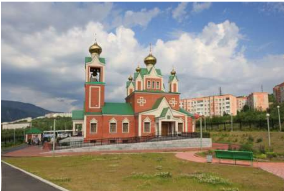
Храм Спаса Нерукотворного Образа на ул.Солнечной