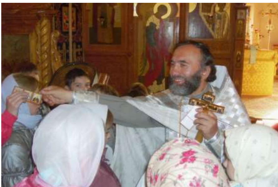
Молебен за учащихся 1 сентября. Поздравление детей.