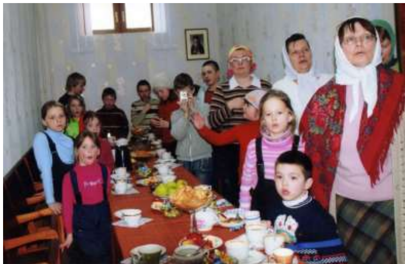
Чаепитие в Воскресной школе