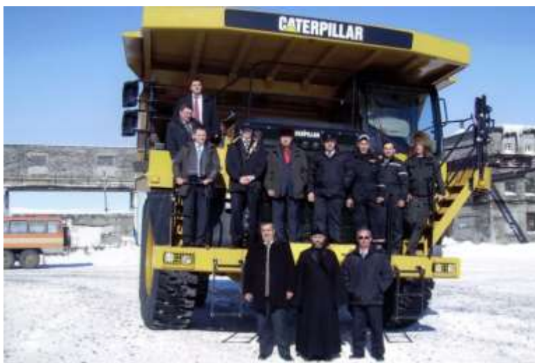
Молебен и освящение на Центральном руднике.

«Апатит»; холдинга «ФосАгро», руководители города и городского совета, Кировского ЖКУ, ООО «Кировсксеверстрой».