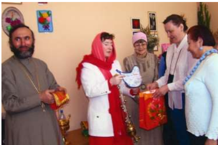
Пасхальный молебен в Волонтерском центре на 25 км. Батюшка поздравляет всех с праздником.