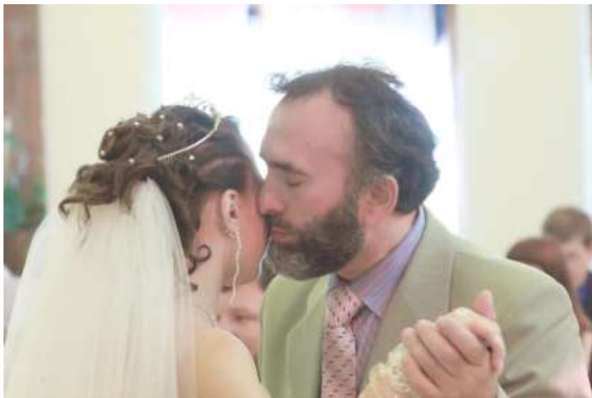
Нанутствие дочери в день свадьбы, 2010 г.

Что еще запомнилось из его уроков и наставлений?