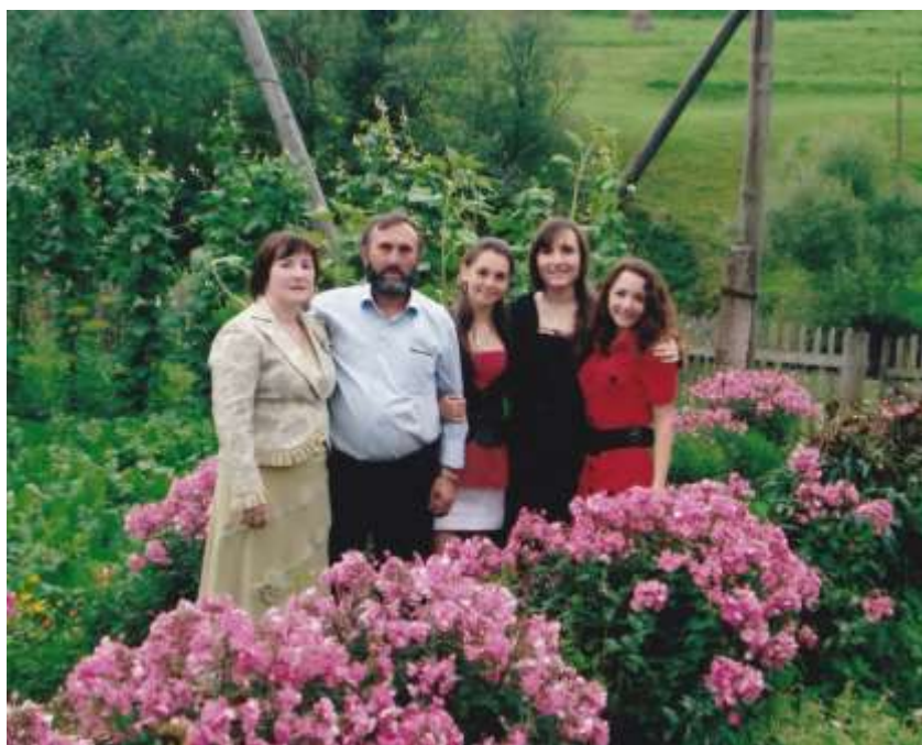
Отпуск на Украине