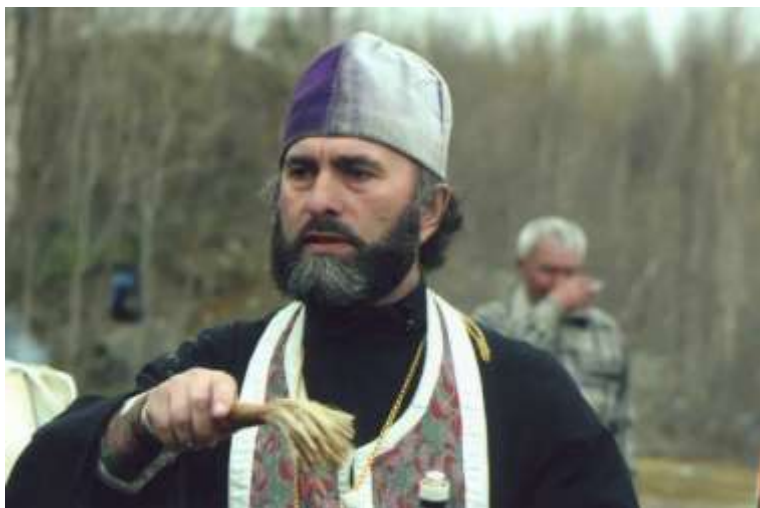
Освящение поклонного креста - памятника спецпереселенцам.