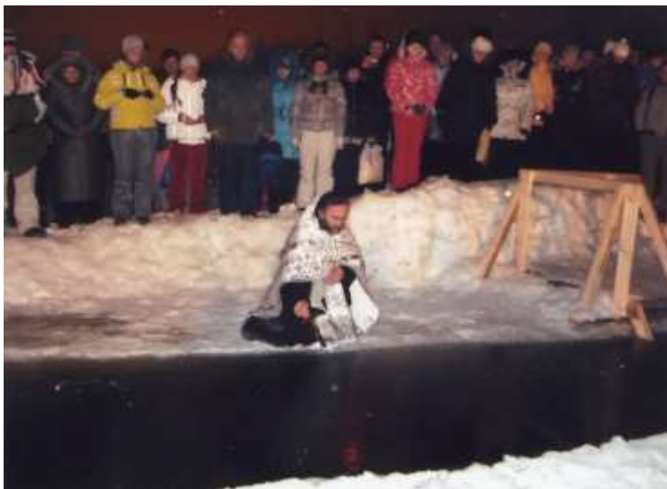
Освящение воды на озере в праздник Крещения Господня.