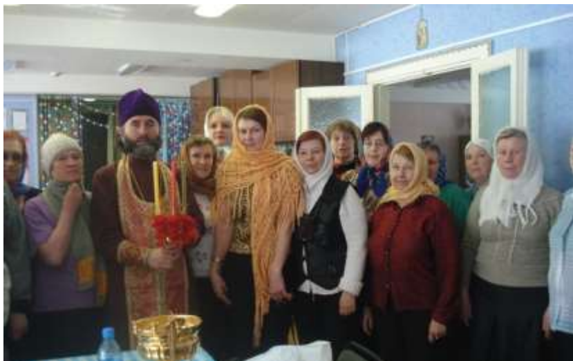
Пасхальный молебен в Центре социального пребывания