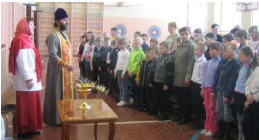
Уроки Доброты в шк. №8 пос. Титан