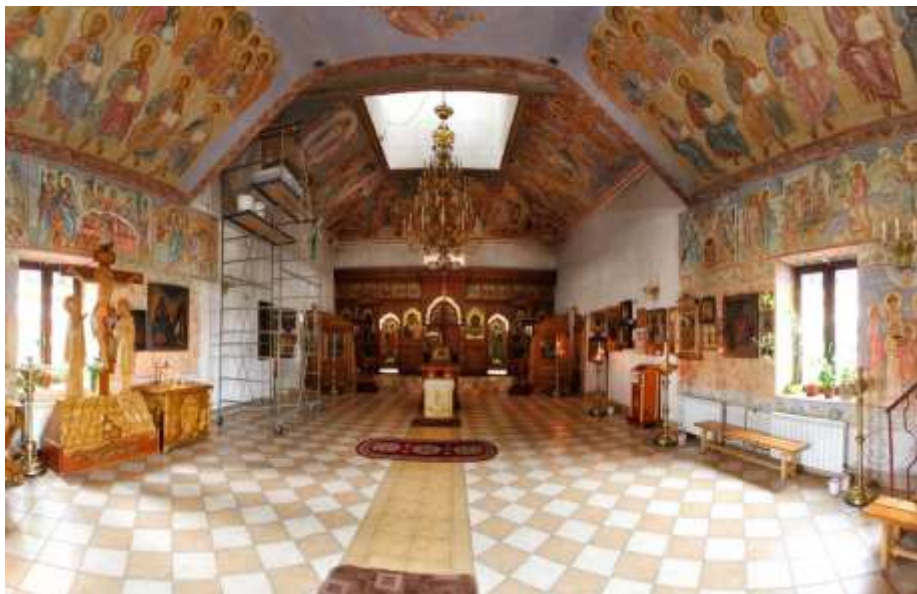
Храм Спаса Нерукотворного Образа

Фрески по сырой штукатурке, по забытым сейчас технологиям, и потому редко используемые, составляют прекрасный ансамбль с чудным иконостасом в стиле XVI в., изготовленным в Свято-Троицком братстве Курской области.