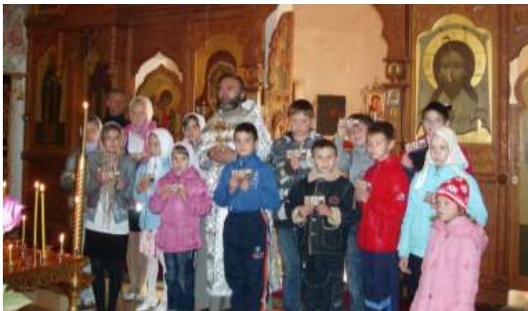
Выступление детей воскресной школы

архиепископ Мурманский и Мончегорский. Его мудрое руководство, промыслительные решения и советы, - укрепляли твердость духа в свершении намеченного.