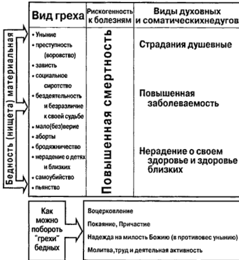
Схема 3. "Бедность не порок", но становится пороком при греховном образе жизни

Но вот что оказывается для нас очень интересным. Люди вне зависимости от их бедности или богатства, живущие во Христе и по церковным канонам, оказываются в гораздо более лучшем положении, чем не живущие со Христом. "Качество" их жизни оказывается во много раз лучшим, нежели тех, кто живет бездуховной жизнью. Вернемся опять к научным исследованиям.