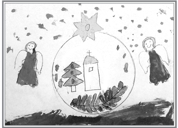
Рис. Нифталиева Романа

В данной ситуации так распорядилась Сама Божья Матерь: кому блинчик комом, а кому и гладкий с румянцем! Но кто очень хотел, к святыне приложился. И Покров Божией Матери над собой и над Россией почувствовал — здесь Она, всегда рядом с нами, не оставит своих почитателей! Серафима Дарина