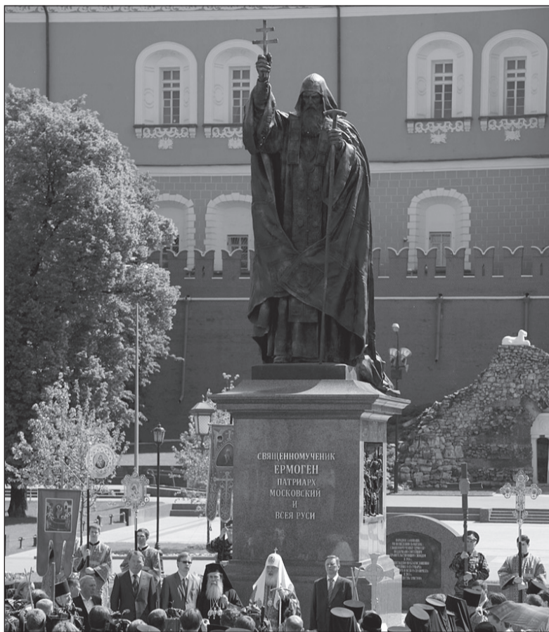
Памятник священномученику Гермогену, патриарху Московскому и всея Руси в Александровском саду у стен Кремля

В 1592 году при святителе Гермогене были перенесены из Москвы в Свяяжск мощи Казанского святителя Германа. В 1594 году митрополит Гермоген составил службу Божией Мате-