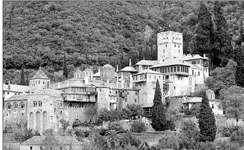
Святая гора Афон. Сербский монастырь Хиландар