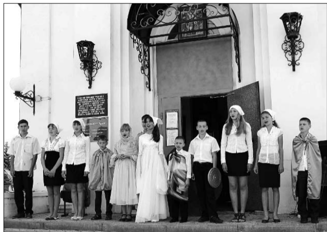
Выступление воспитанников Воскресной школы

Вести Миссионерского Центра Вести Миссионерского Центра Вести Центра