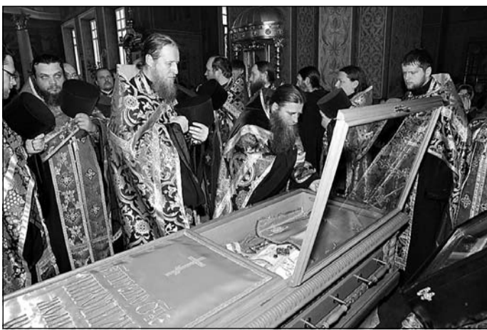
В Преображенском соборе священнослужители прикладываются к мощам священномученика Никодима (Кононова)

Вечером следующего дня Владыка был вновь тайно увезен прямо из алта-