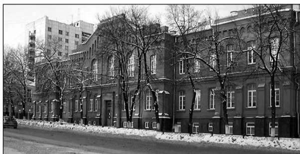
Центра Вести Миссионерского Центра

Вести Миссионерского Центра Вести Миссионерского Центра Вести Центра