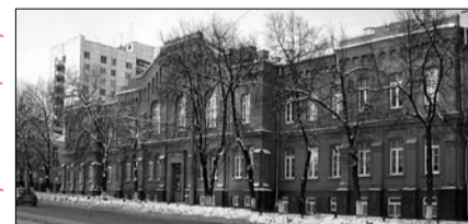
Миссионерского Центра Вести Миссионерского Центра

В здании социально-теологического факультета Белгородского государственного университета (ул. Преображенская, 78) возобновляются занятия Православного Молодежного Миссионерского Центра.