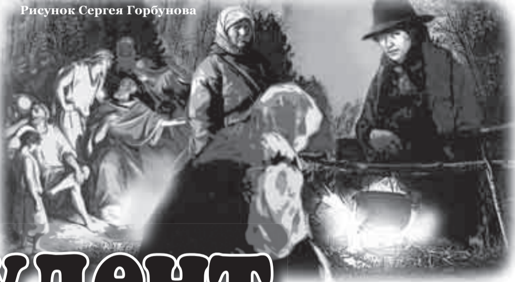
Рисунок Сергея Горбунова

Теперь студент думал о Василисе: если она заплакала,