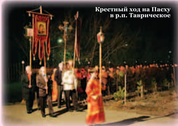
Крестный ход на Пасху в р.п. Таврическое

Что такое Крестный ход и когда он бывает?