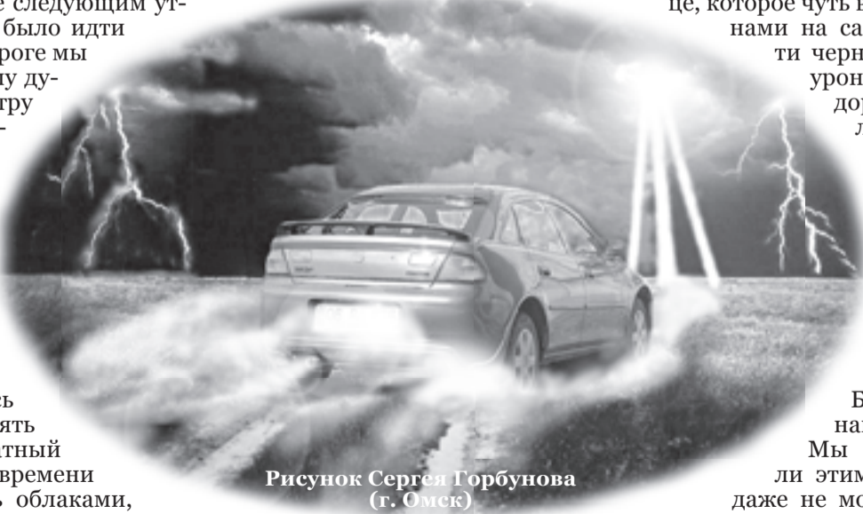
Рисунок Сергея Горбунова (г. Омск)

Но главное чудо было впереди. Солнце, которое чуть виднелось перед нами на самом краю почти черного неба, вдруг уронило на нашу дорогу три ярких луча, хорошо различимых среди окружающего нас мрака. Затаив дыхание, мы с восхищением в сердце летели вперед, понимая, что только Богу подвластно наше спасение. Мы так дорожили этим чувством, что даже не могли разговаривать. Вскоре, преодолев десятки километров, мы наконец-то добрались до асфальта. Здесь было сухо и солнечно. Выйдя из машины, мы оглянулись. На наших глазах дорога, по которой мы только что промчались, скрылась в серой пелене дождя. Благодаря Бога за Его милость, мы благополучно доехали до дома.