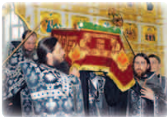
Иисуса Христа, как оно было снято с креста и положено во гроб.

— Этот скорбный и плачевный Крестный ход совершается в воспоминание погребения Иисуса Христа, когда тайные ученики Его Иосиф с Никодимом, в сопровождении Матери Божией и жены-мироносицы, несли на руках умершего на кресте Иисуса Христа. Они шли от горы Голгофы до виноградника Иосифа, где была погребальная пещера, в которую, по обычаю иудейскому, положили тело Христово. В воспоминание этого священного события — погребения Иисуса Христа — и совершается Крестный ход с Плащаницей, которая представляет тело умершего