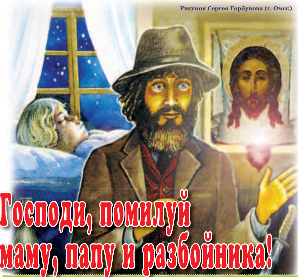
Рисунок Сергея Горбунова (г. Омск)

Духовно-просветительское издание для детей. Для младшего и школьного возраста.