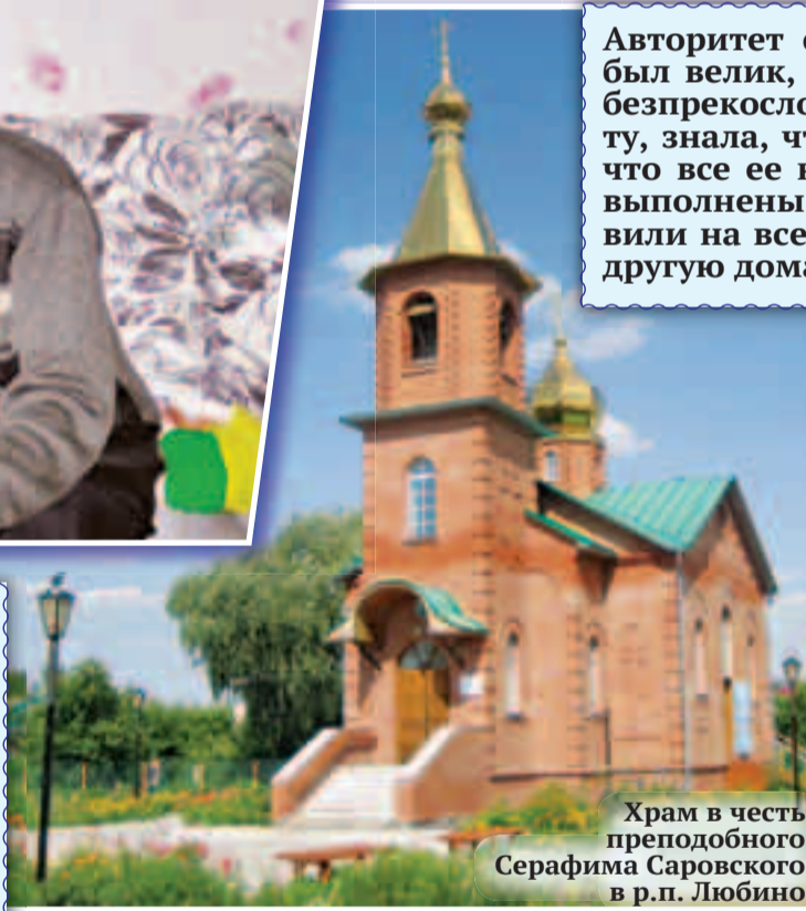
Храм в честь преподобного Серафима Саровского в р.п. Любино

Авторитет старших сестер и братьев был велик, их указания выполнялись беспрекословно. Мама, уходя на работу, знала, что в доме будет порядок и что все ее наказы и поручения будут выполнены. Старшие девчата готовили на всех, а остальные выполняли другую домашнюю работу.