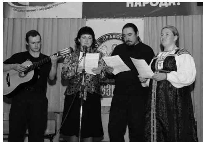
Исполнение Гимна трезвости.