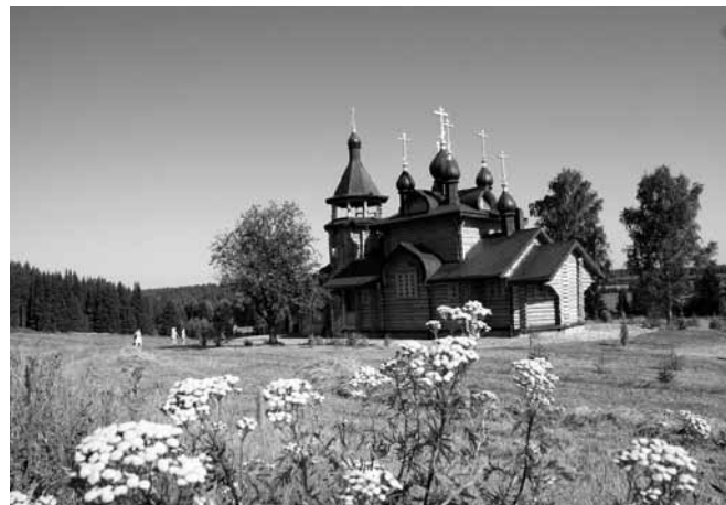
Храм Всех Святых, в земле Сибирской просиявших, на месте молитвенных подвигов св. прав. Симеона Верхотурского.

мученике Константине Меркушинском. Во время его обучения в Пермской Духовной семинарии ректором был архимандрит Пимен (Белоликов), ныне прославленный в сонме новомучеников и исповедников XX века. Он был одним из лидеров трезвенного движения в Перми. Если ректор был носителем такой идеологии, то, вероятно, и студенты в той или иной мере были сопричастниками этой деятельности. Известно, что в нашей епархии прославлен как священномученик Александр Малиновский, также выпускник Пермской семинарии. Последнее место его служения — Введенская церковь села Верх-Суксунского Красноуфимского уезда. В его послужном списке зафиксировано, что он был председателем общества «Трезвение». Вероятнее всего, были в начале XX века еще деятели трезвенного движе-