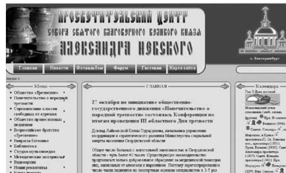
Сайт Просветительского центра собора Александра Невского Ново-Тихвинского монастыря.