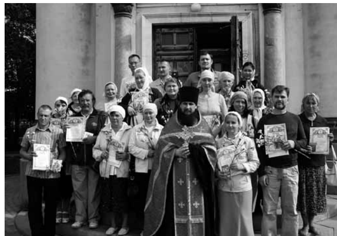
После молебна и принесения Обета трезвости, 11 сентября 2009 г.

• позитивность: действие должно быть ярким, светлым, красивым, а не пугать участников количеством алкоголиков, наркоманов, «пьяных» пожаров и т.д.;