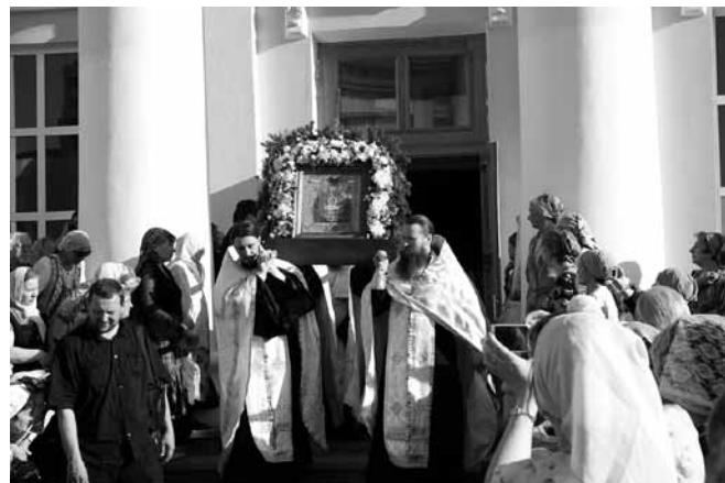
Крестный ход в Екатеринбурге 14 мая 2010 г. с чудотворной иконой Божией Матери «Неупиваемая Чаша».

В Твери 11 сентября 2005 г. День трезвости был не простым, а авиационным. Произошло это впервые в новейшей истории России. На самолете АН-2 город облетела икона «Неупиваемая