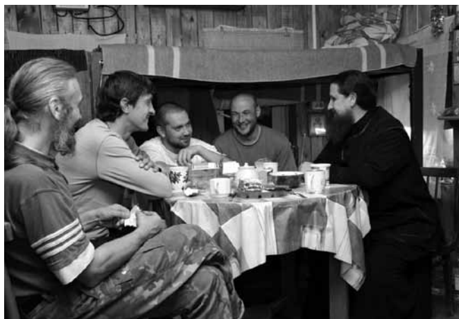
Беседа с реабилитантами в Доме трудолюбия (с. Черноусово Свердловской обл.).

После окончания занятий из благоприятной атмосферы единомышленников, стремящихся жить трезво, человек возвращается к прежней своей жизни. К сожалению, социальная среда, которая сформировала и питала в нем этот порок, из которой человек пришел на занятия, за время происходящих в нем перемен совсем не изменилась, и теперь в ней этот человек становится объектом насмешек. Именно в этот период страждущему, как никогда ранее, необходимы дружеская помощь и поддержка опытного человека, находившегося в таких же обстоятельствах, сознающего личную ответственность перед Богом за благополучный исход дела. Он является как бы старшим собратом и с христианской любовью терпеливо помогает пройти через эти естественные испытания. Участие в де-