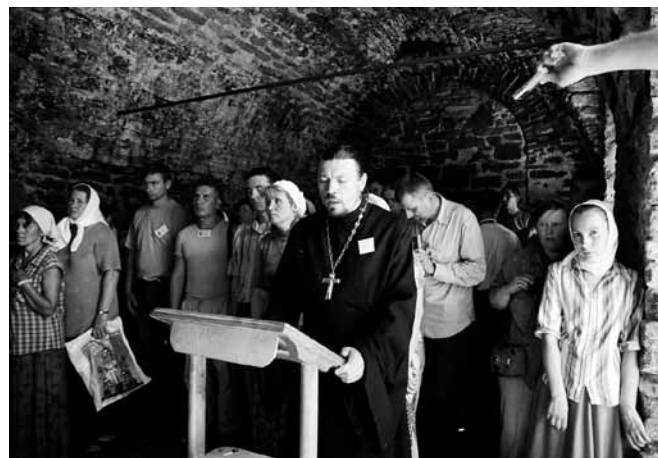
Молитва паломников общества «Трезвение» в склепе, где хранились мощи прпмц. Елисаветы и других алапаевских мучеников.

Краеведение и краеведческое движение являются действенным средством формирования трезвенных убеждений, воспитания чувства патриотизма и сопричастности к важному делу отрезвления Отечества. В то же время краеведение как всесторонняя научная и научно-популярная деятельность по изучению истории и ее особенно-