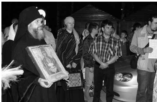
Ночной автомобильный Крестный ход вокруг г. Екатеринбурга 14 мая 2010 г. с чудотворной иконой Божией Матери «Неупиваемая Чаша».

«Праздник трезвости — 2006» (Республика Татарстан) проходил под девизом «Возьми