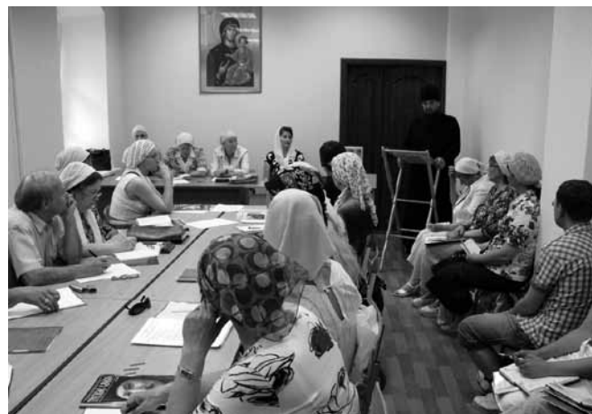
Учебно-практическая конференция в Катехизаторской школе Общества «Трезвение».

Помимо молитвенных собраний и встреч десятки участвуют во всех других мероприятиях, организуемых обществом «Трезвение»: оказывают помощь при наборе новой группы, при организации и проведении очередных курсов для страждущих; трудятся на послушаниях, организованных для помощи монастырю; помогают в издании и распространении «Листков трезво-