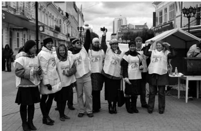
II областной День трезвости, пост трезвости на улицах города, 2009 г. (фото сверху); III областной День трезвости, пост трезвости, 2010 г. (внизу).