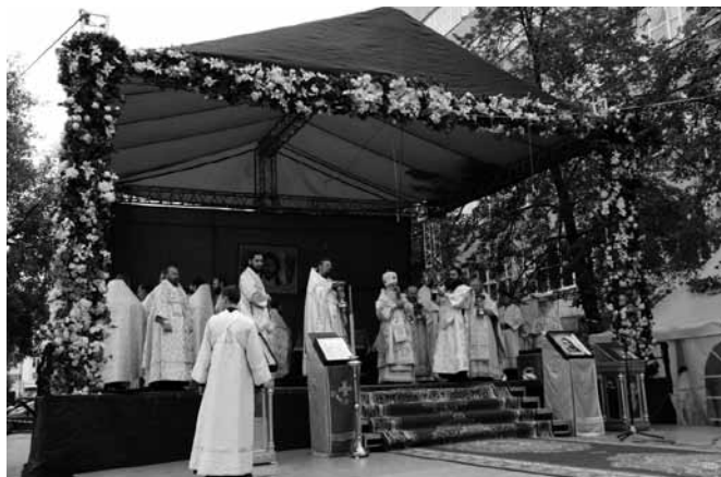
III областной День трезвости. Первая Литургия на месте разрушенного собора св. вмц. Екатерины — небесной покровительницы г. Екатеринбурга.

4) привлечение на свою сторону депутатов всех уровней, глав администраций, политических и общественных организаций, представителей средств массовой информации;