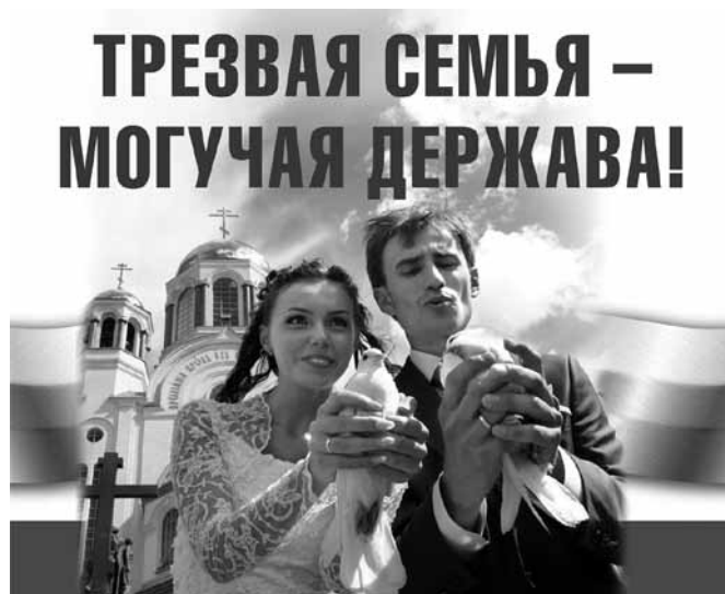
Социальная реклама, разработанная обществом «Трезвение».

В наше время идет процесс возрождения православных трезвенных традиций. При приходах создаются общества трезвости и трезвения (сейчас таких в России около 50), возобновилась практика принесения обетов трезвости. Расширение