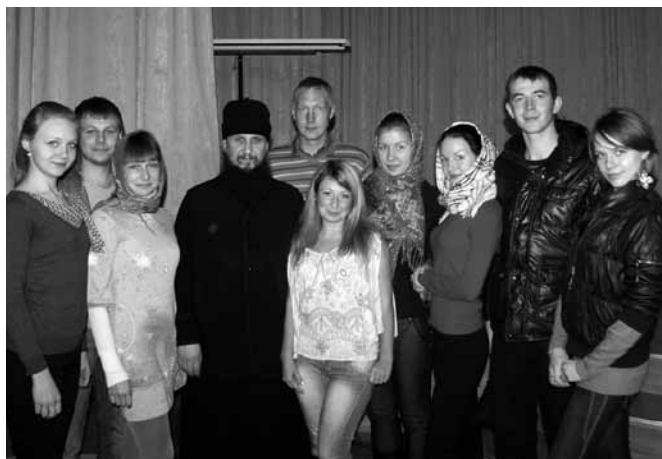
Молодежный клуб Общества «Трезвение».

Деление на группы способствует снятию психологических барьеров в общении между слушателями курса и сплочению их в монолитный, деятельный, живой организм, имеющий общую направленность на достижение трезвости.