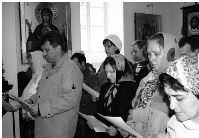
Молебен с принесением обета трезвости.

Обеты трезвости, таким образом, даются самими страждущими, их родственниками и людьми, занимающимися трезвенной работой, для укрепления себя в этом подвиге. После чинопоследования