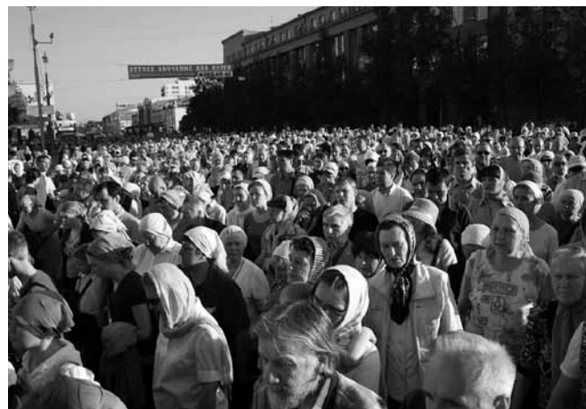
Молитва во время Крестного хода .

Горожане увидели необычную выставку, на которой была представлена экспозиция «трезвой» символики: значки, марки, а также слайды программ конца XIX — начала XX века. Всего в празднике приняли участие несколько сотен школьников, студентов, психологов, социальных работников и педагогов, а также активистов обществ трезвости. Финальным аккордом этого дня стала раздача листовок, содержащих информацию о вреде алкогольных напитков. Впервые на этом мероприятии не было замечено ни одной сигареты, ни одного курильщика.