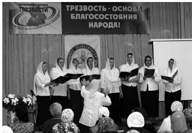
Выступление хора «Единогласие» Общества «Трезвение».

Творческими коллективами общества «Трезвение» являются два хора: «Единогласие» и «Седмица». Они созданы с целью объединения людей, стремящихся к духовной жизни, на основах творческой самореализации, утверждения в трезвости как правиле жизни, возрожде-