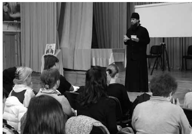
Занятия по избавлению от зависимости.

Тема шестого занятия: «Действие табака и алкоголя на организм человека». Цель занятия — разъяснение слушателям механизма разрушающего действия продуктов табачного дыма на организм человека. Ознакомившись с экспонатами и слайдами, демонстрирующими разрушающее действие алкоголя и табака на внутренние органы человека, слушатели еще более утверждают в необходимости для себя и своей семьи трезвого образа жизни. Большинство слушателей после этого занятия утверждает в реальности полного воздержания от упо-