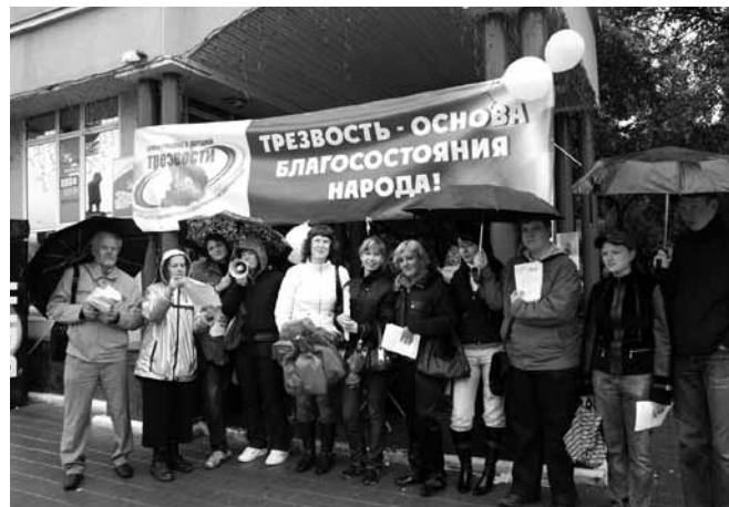
II областной День трезвости, круглый стол «Только б жила Россия». Участники — молодежь вузов Екатеринбурга. 2009 г. (фото вверху); I областной День трезвости. Екатеринбург, 2008 г. (внизу).