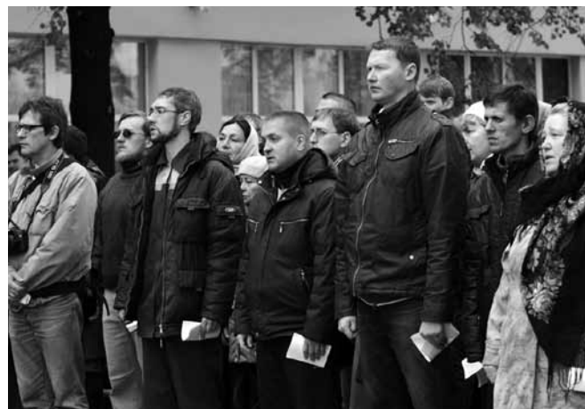
Молебен с принесением Обета трезвости 11 сентября 2010 г.

Уже дважды в декабре и январе проводился крестный ход на автобусах и автомобилях вокруг Екатеринбурга с иконой Божией Матери