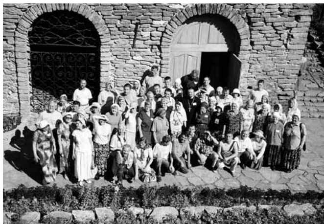
Паломничество участников VIII Всероссийской встречи православных трезвенников, 2006 г., г. Алапаевск.

Деятельность хоров окормляет духовник общества. Регента хора благословляет на должность духовник общества «Трезвение» и утверждает правление общества. Для решения организаци-