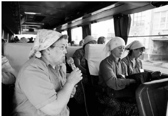
Паломничество Общества «Трезвение» в с. Меркушино к месту подвигов св. прав. Симеона Верхотурского.

Члены общества «Трезвение» занимаются сбором дополнительной информации о священно-