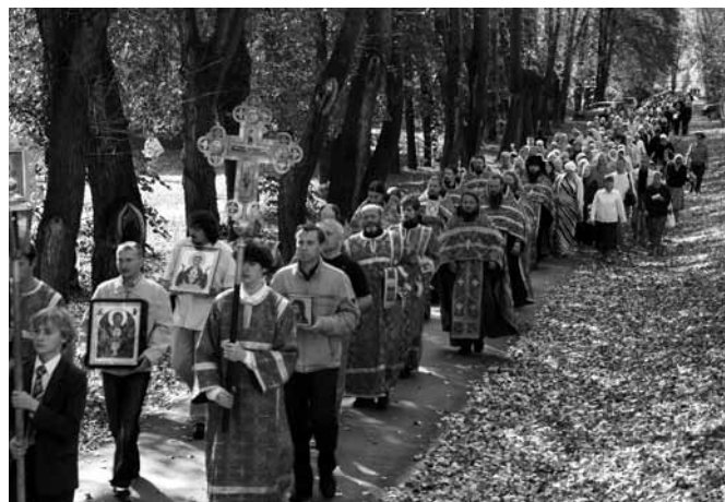
Крестный ход в День трезвости 11 сентября 2009 г.

Раздавались материалы по трезвости на ули-