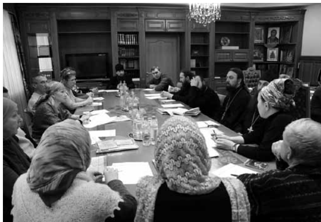
Секция «Организация обществ трезвости на приходе» конференции «Утверждение трезвости в современном обществе», 2008 г.

тельств в Свердловской области. 20 марта 2008 года состоялась Учредительная конференция, по итогам которой было принято решение о создании общественно-государственного движения «Попечительство о народной трезвости». Принято Положение (см. Приложение 14), выбран совет (см. Приложение 16), составлен план работы (см. Приложение 17), заключено соглашение о сотрудничестве между Екатеринбургской епархией Русской Православной Церкви и Правительством Свердловской области (см. Приложение 13).