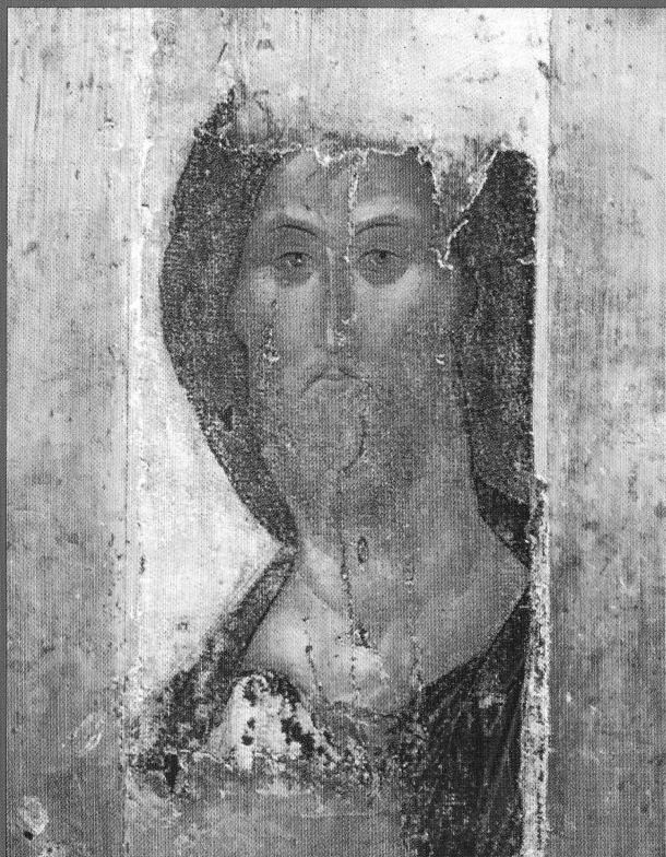
Спас Вседержитель. XV в. Икона преподобного Андрея Рублёва