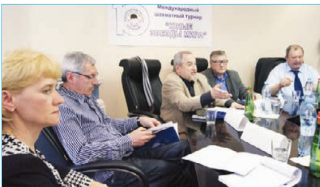
Участники пресс-конференции в представительстве ООО «КИНЕФ» в Санкт-Петербурге.