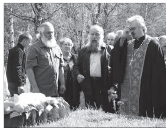
Возложение цветов и панихида на мемориале «Памяти павших».