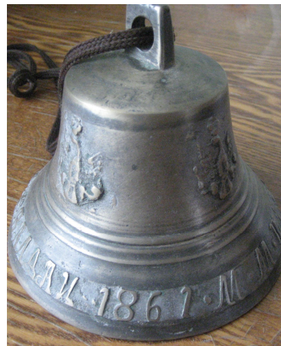
Малый церковный колокол из ликвидированного в 30-х годах храма.