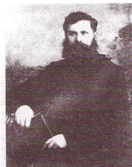
Александр Климентьевич Касатский