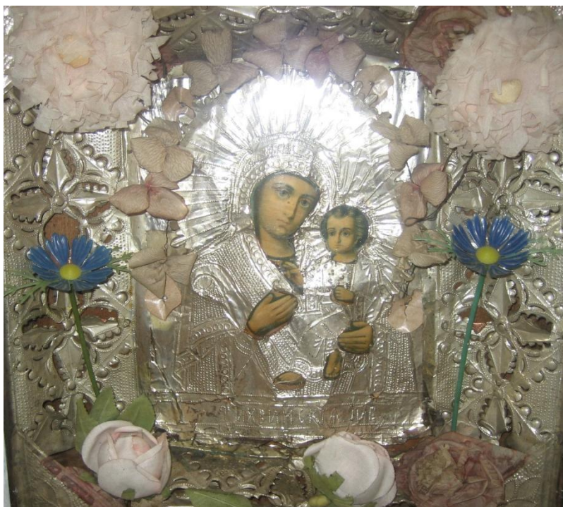
Список Тихвинской иконы Божьей Матери.