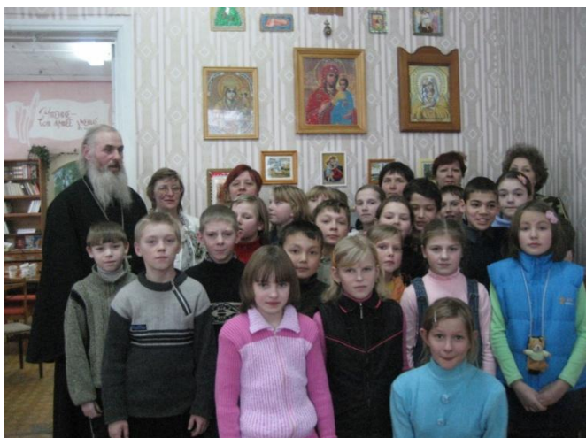
Открытие выставки в здании детской библиотеки.