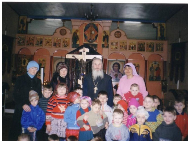
Воспитанники детского сада в церкви.