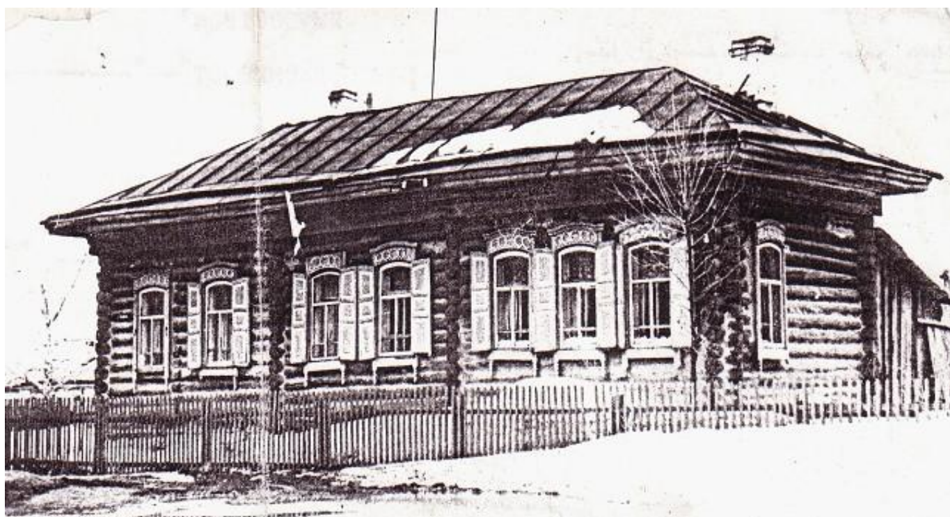
Одноклассное сельское училище.