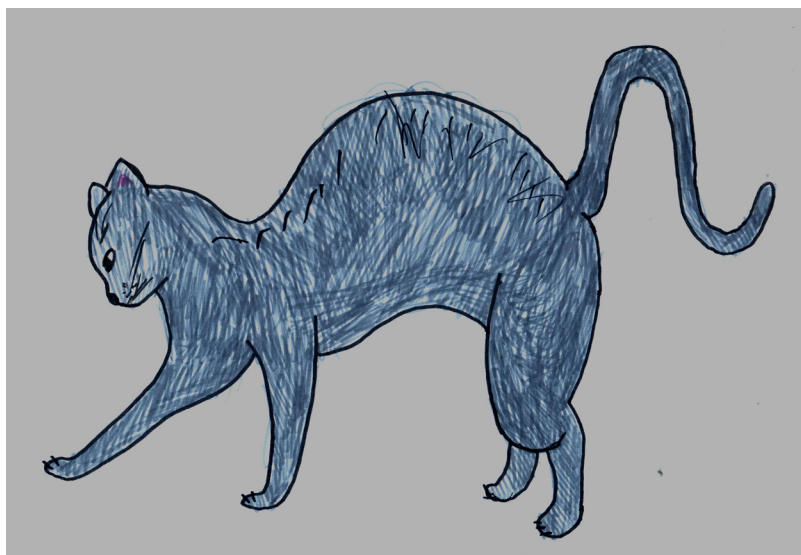
Рисунок Анастасии Монастыревой, 12 лет