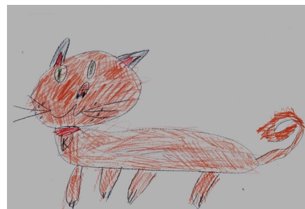
Рисунок Александра Гордиенко, 7 лет