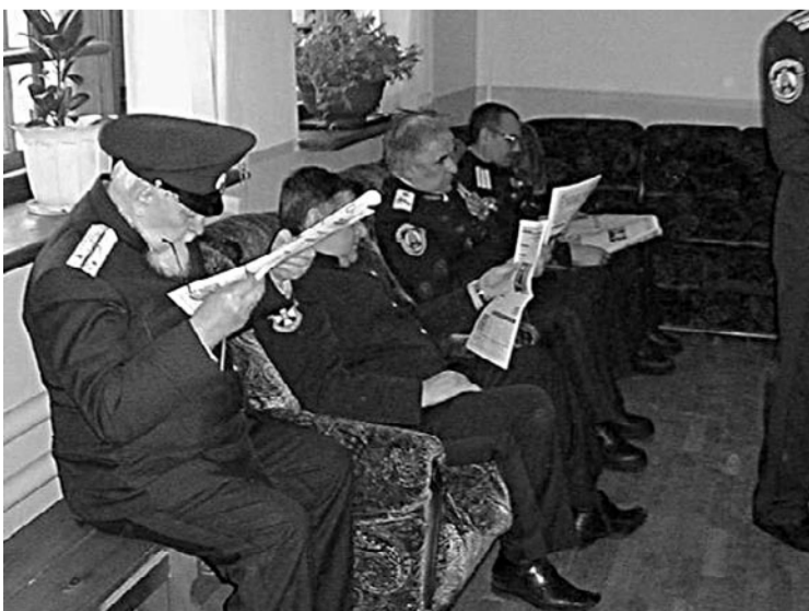
Участники Совета атаманов изучают газету «Казак России»