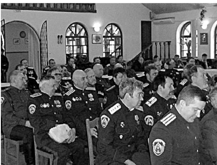
В зале участники Совета атаманов