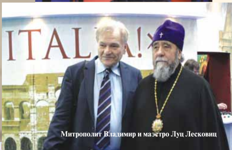
Митрополит Владимир и маэстро Луц Лесковиц