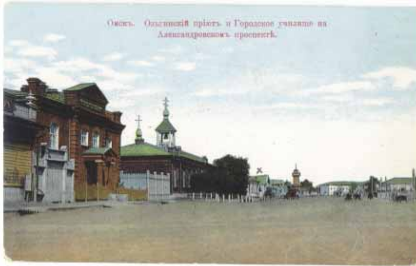
Омск. Общественный праздник в Городском саду на Давыдовском проспекте.

Иоанно-Предтеченское общество трезвости устраивало 9 мая в зале 2-го классного